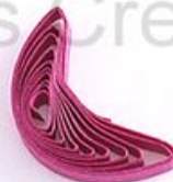
изогнутый полукруг (месяц, полумесяц)