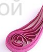
изогнутая капля (крыло, лепесток)