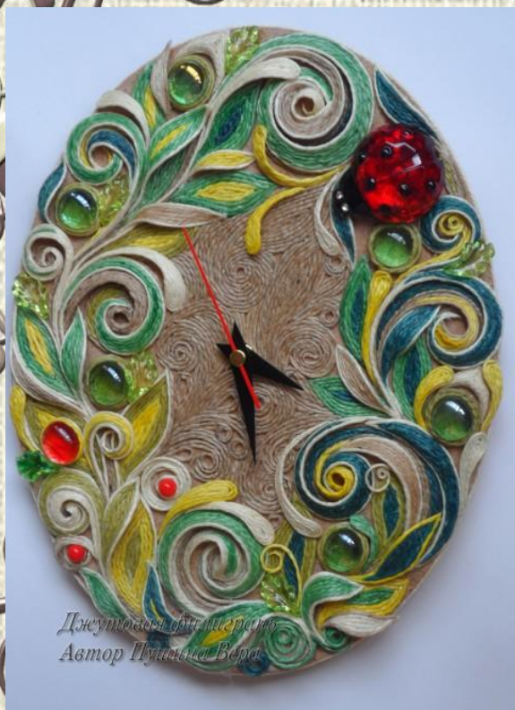
Джутовая літэратура Автар Пуніаца Вера