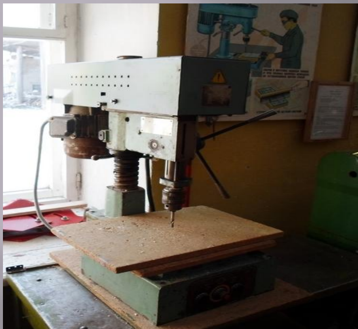
НС - 12

станки, на которых изготавливают детали и изделия