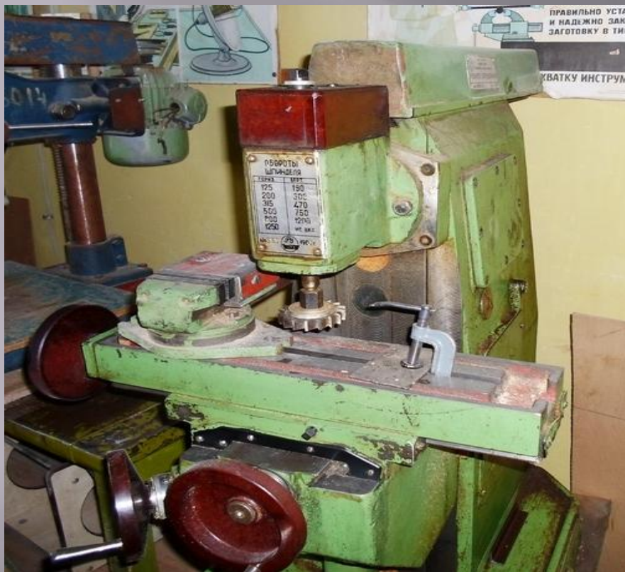
НГФ - 110 м4