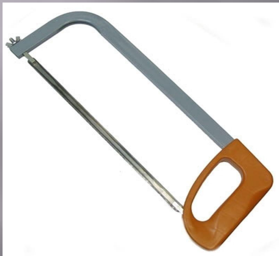
пилка по металлу