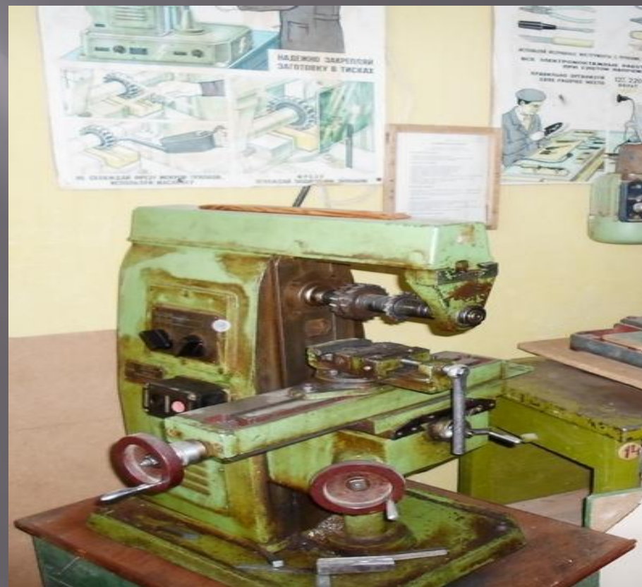
НГФ - 110 м3