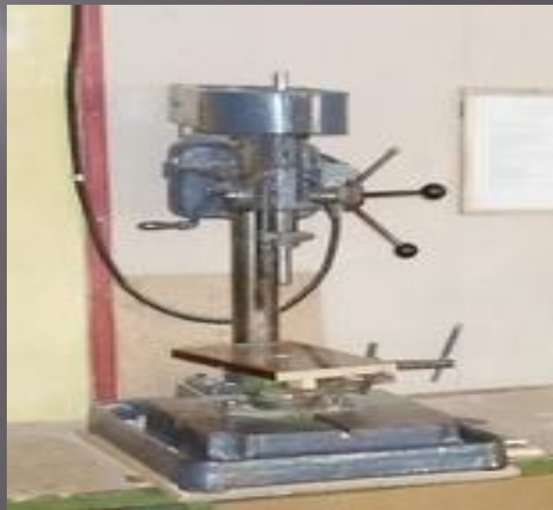
М - 112