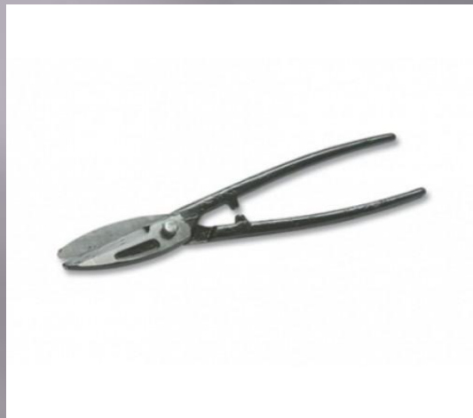
ножницы по металлу