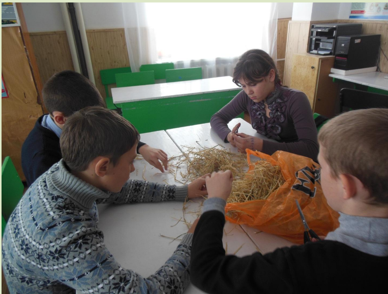
Заготовка соломенных трубочек