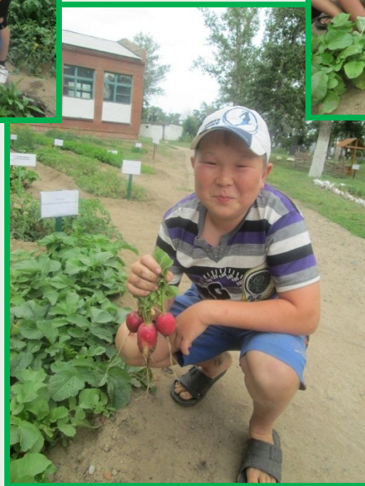
Сбор первого урожая