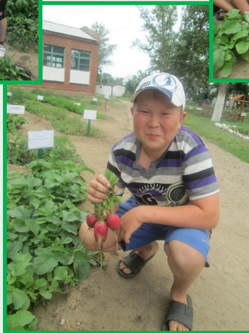
Сбор первого урожая