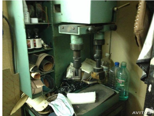
Пресс ППГ – 4 – О