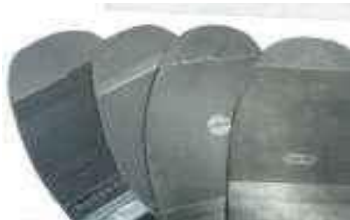
готовые профилактические подметки