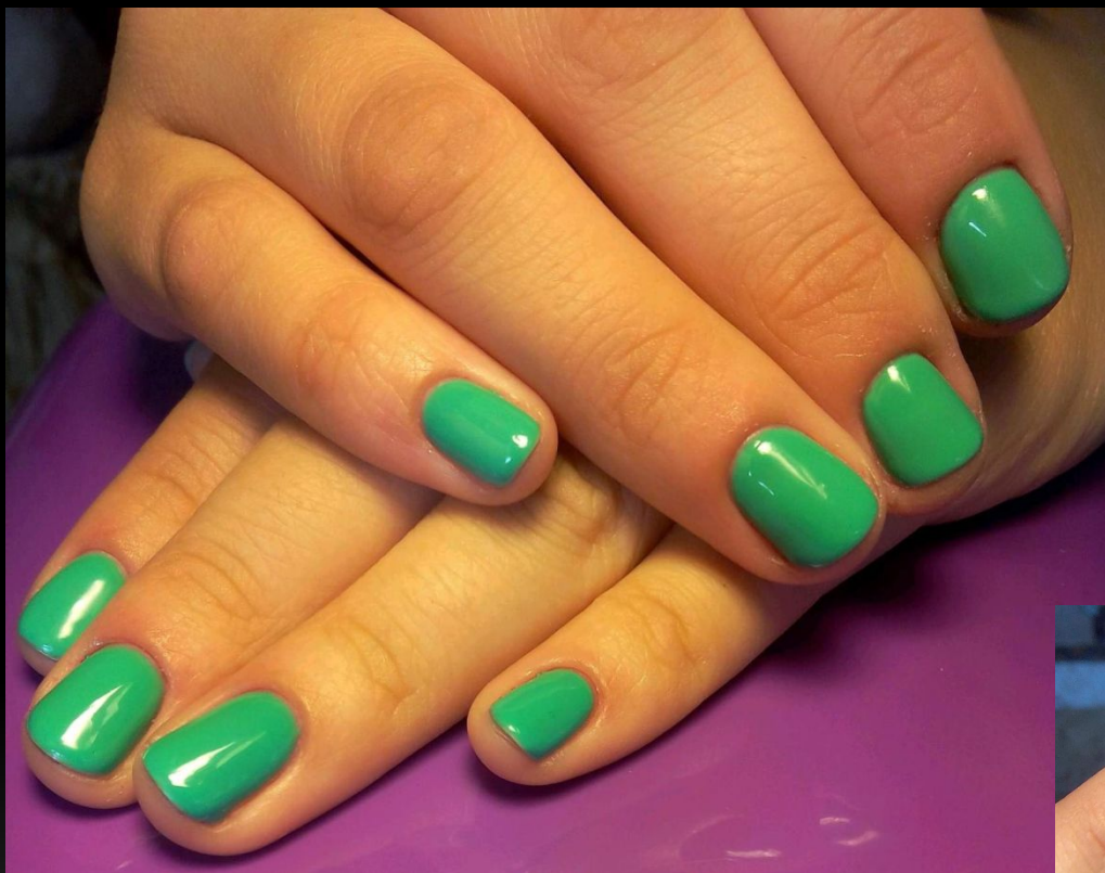
Покрытие гель-лак+ дизайн