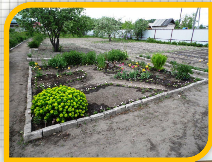
Отдел цветочно-декоративных культур