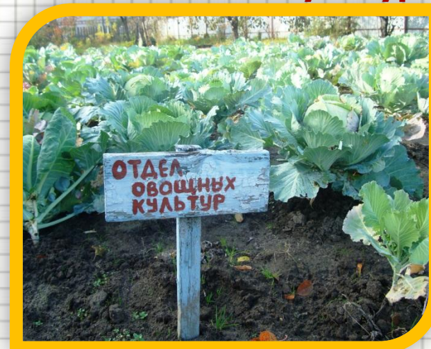
Отдел овощных культур