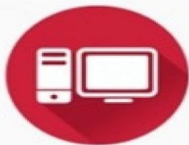
Ремонт компьютеров и ноутбуков