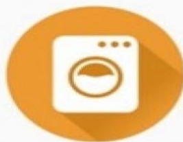
Установка и ремонт бытовой техники