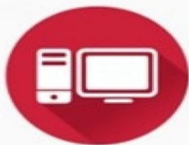
Ремонт компьютеров и ноутбуков