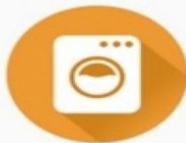
Установка и ремонт бытовой техники