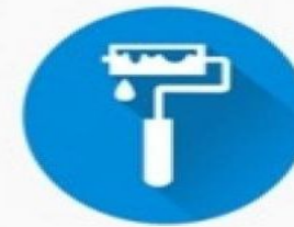
Ремонт и отделка помещений