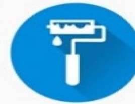
Ремонт и отделка помещений