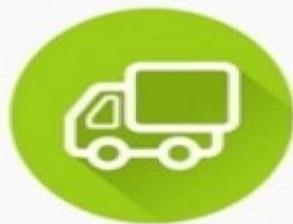
Грузоперевозки и грузчики