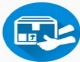
Услуги курьеров и доставка