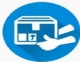
Услуги курьеров и доставка