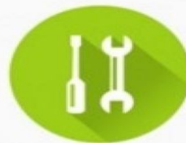
Мастера на час: сантехник, электрик, плотник