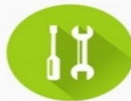
Мастера на час: сантехник, электрик, плотник