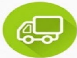
Грузоперевозки и грузчики