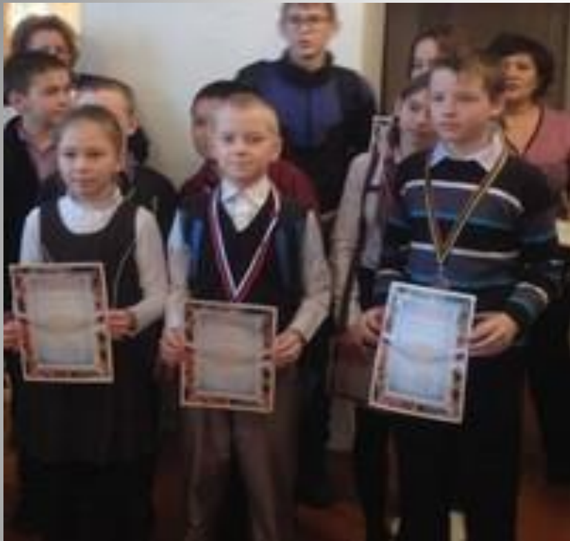
2016 учебный год