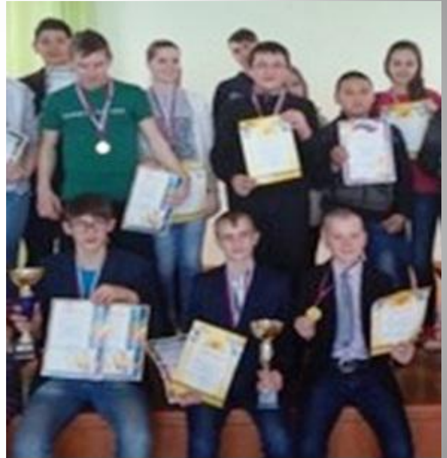
2017-2018 учебный год