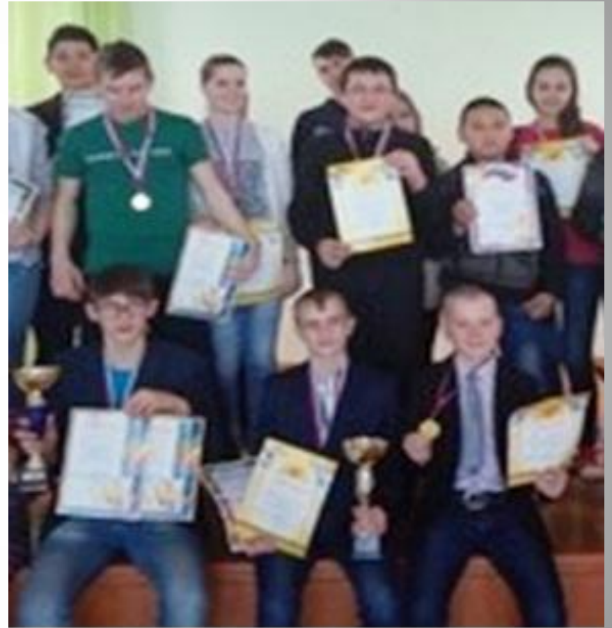
2017-2018 учебный год