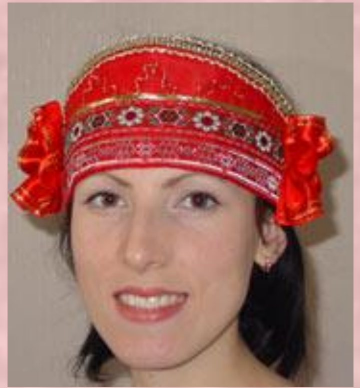
Головной убор "Кичка".