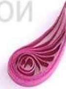
изогнутая капля (крыло, лепесток)