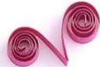
завиток в форме V