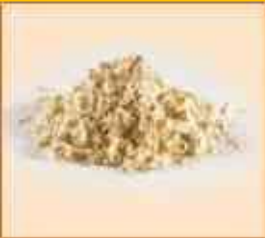
Белок яичный сухой пастеризованный обессахаренный