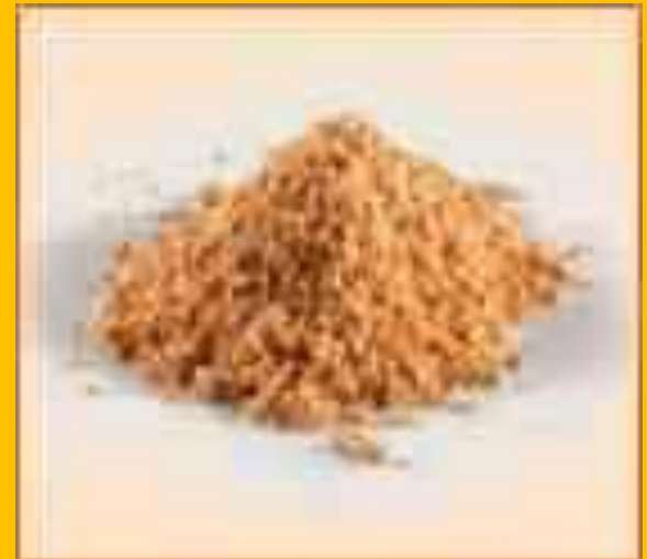
Желток яичный сухой пастеризованный.