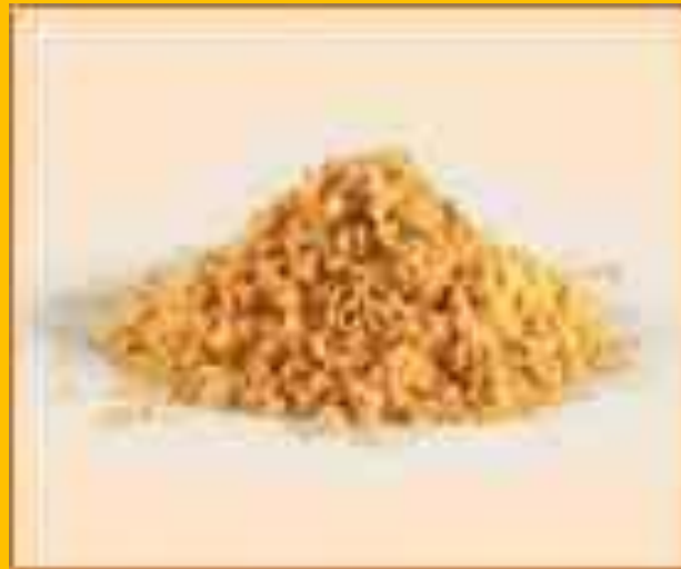
Порошок яичный сухой пастеризованный.