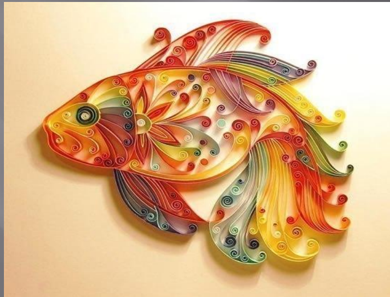
Рисунок или фотография практической части вашего проекта