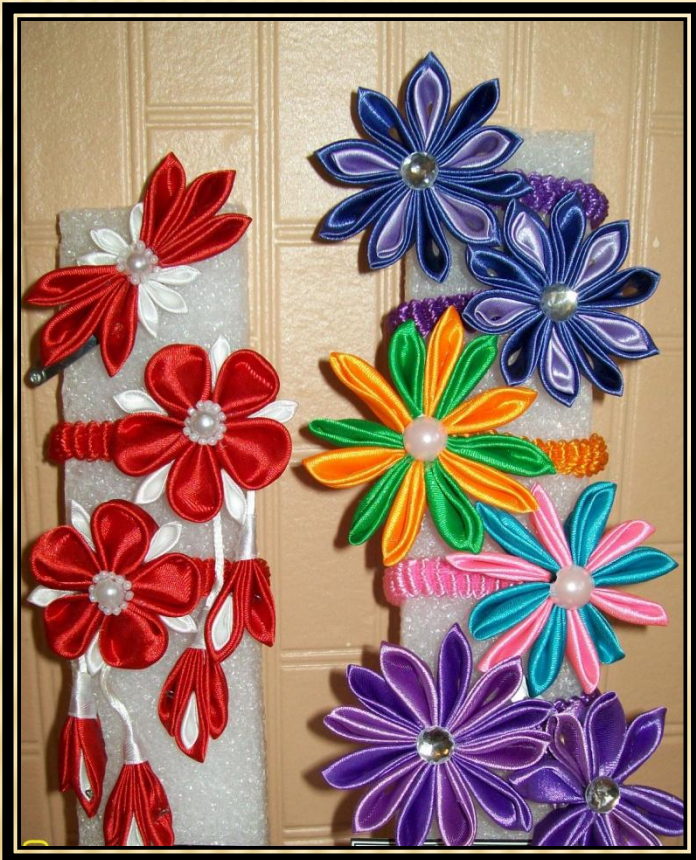
Изготовление заколок в технике «Канзаши- Цунами»