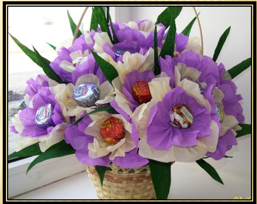
Изготовление конфетных букетов