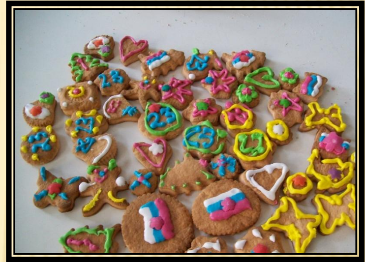
Выпечка из разных видов теста