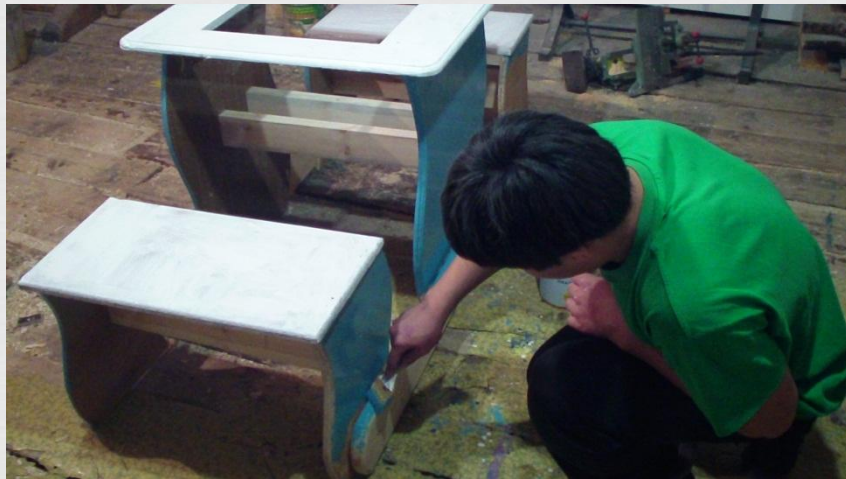
Отделка изделия краской