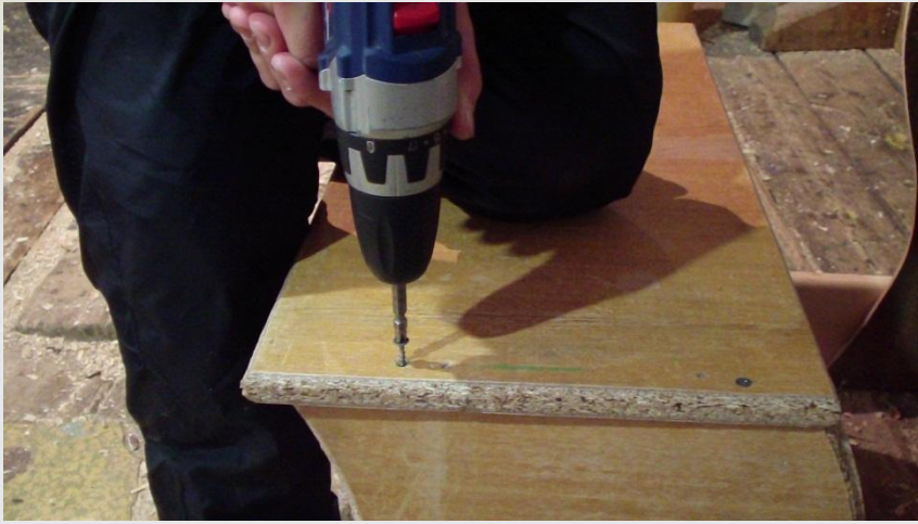
Закрепление деталей с помощью шурупа