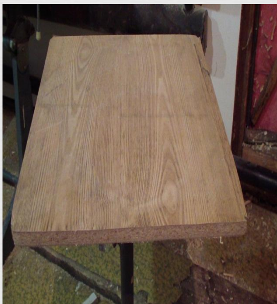
ДСП (древесно-стружечная плита)