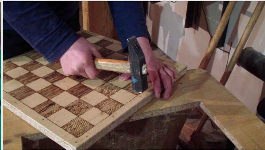
Закрепление досок с помощью гвоздя