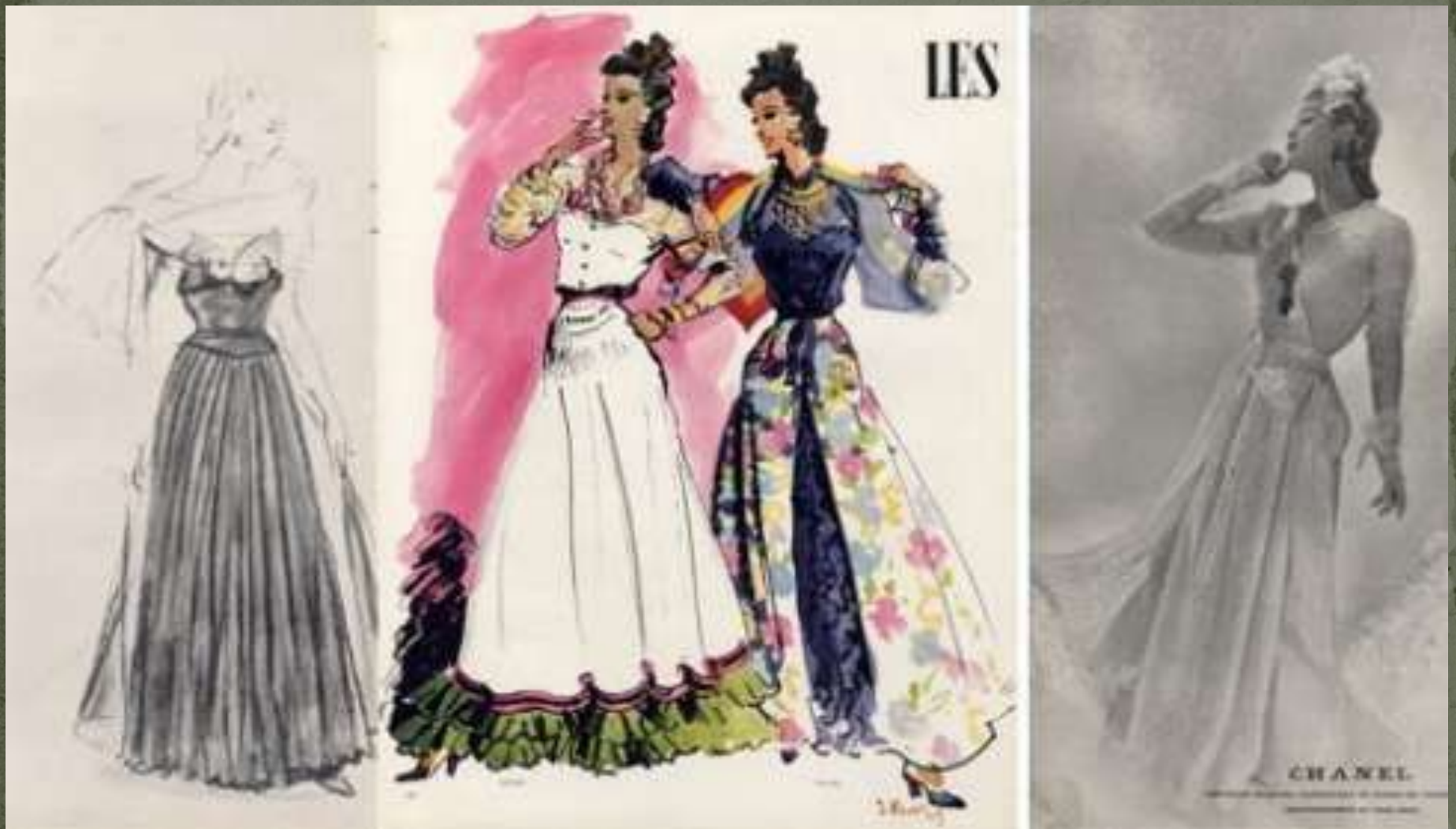
Коллекция 1939 г - юбки плиссе