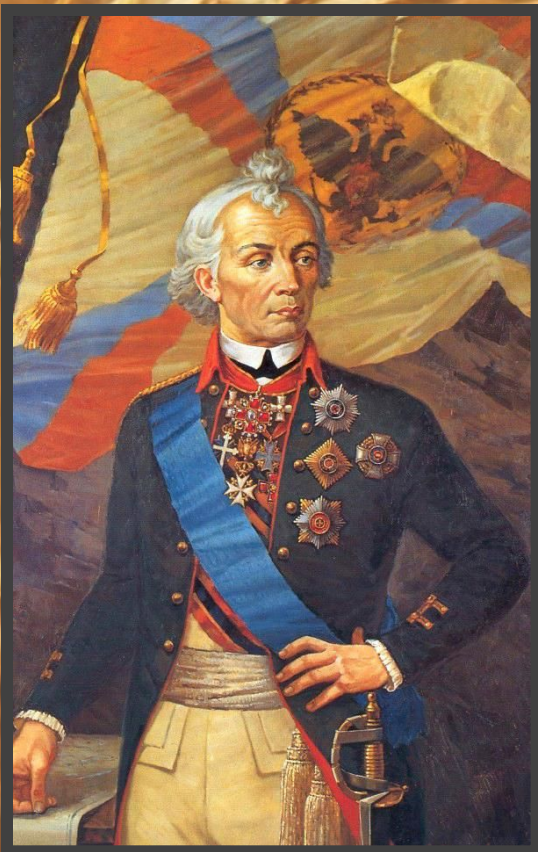
Суворов А.В. 1730 -1800 гг.

КАША – СОЛДАТСКАЯ ЕДА, ПОЕЛ НЕМНОЖКО – УЖЕ СЫТ.