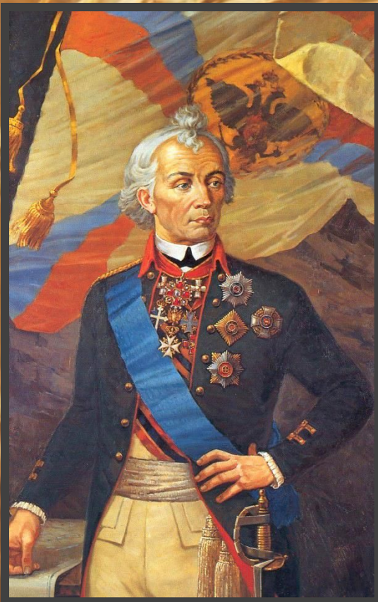
Суворов А.В. 1730 -1800 гг.

КАША – СОЛДАТСКАЯ ЕДА, ПОЕЛ НЕМНОЖКО – УЖЕ СЫТ.