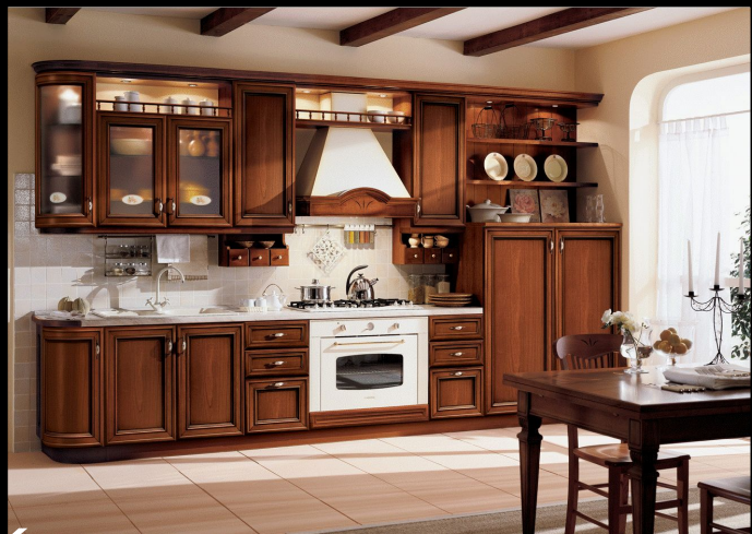
Кухня в современном стиле