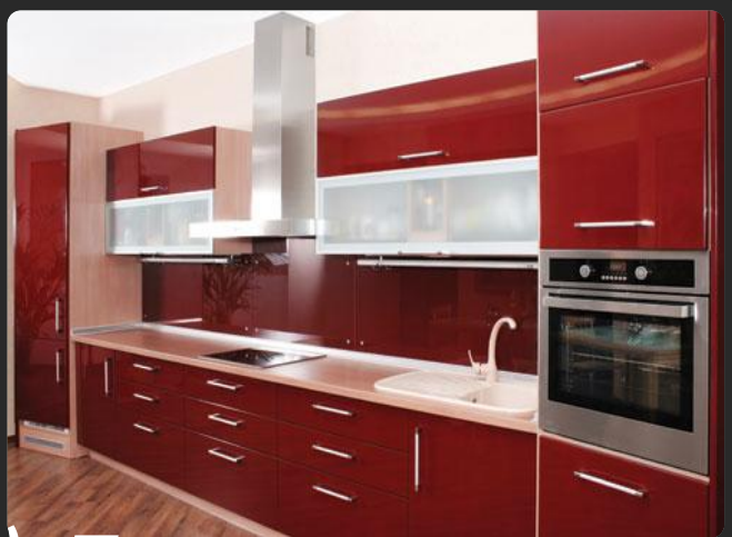
1) Линейная кухня