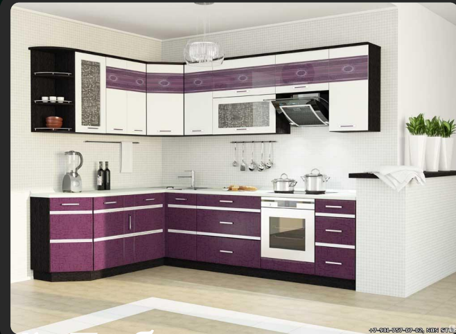
2) Угловая кухня