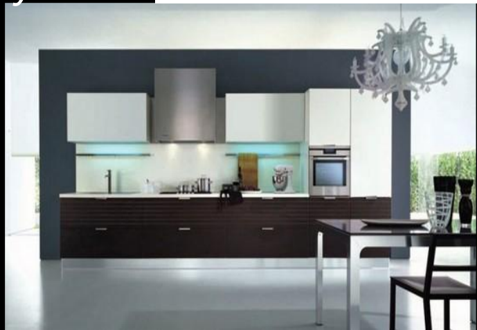
Кухня в стиле минимализм