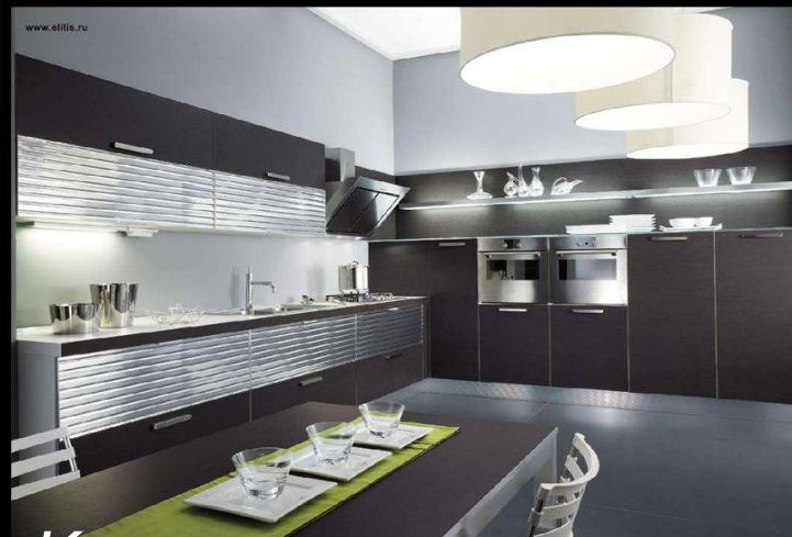
Кухня в современном стиле