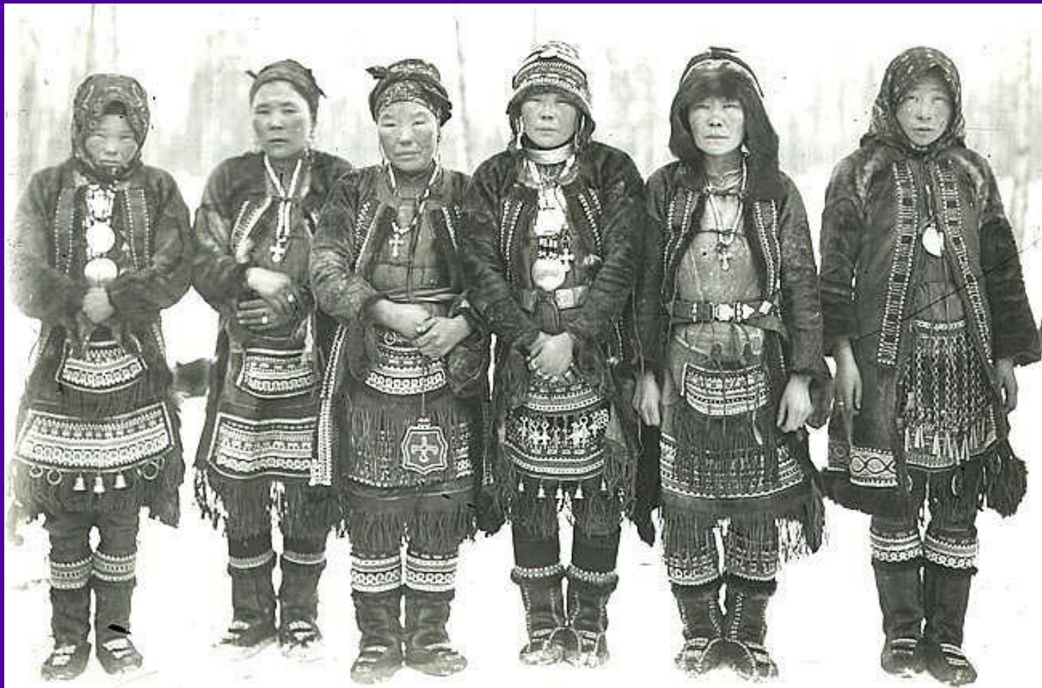
Фото 20-х годов 19 века

■ Национальный костюм имеет не только прикладное значение, это - важнейшая составляющая национальной культуры любого народа.