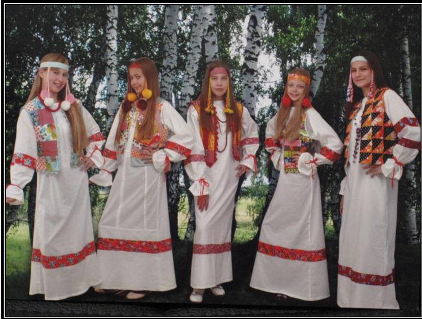
КОЛЛЕКЦИЯ «РУССКИЙ СТИЛЬ»