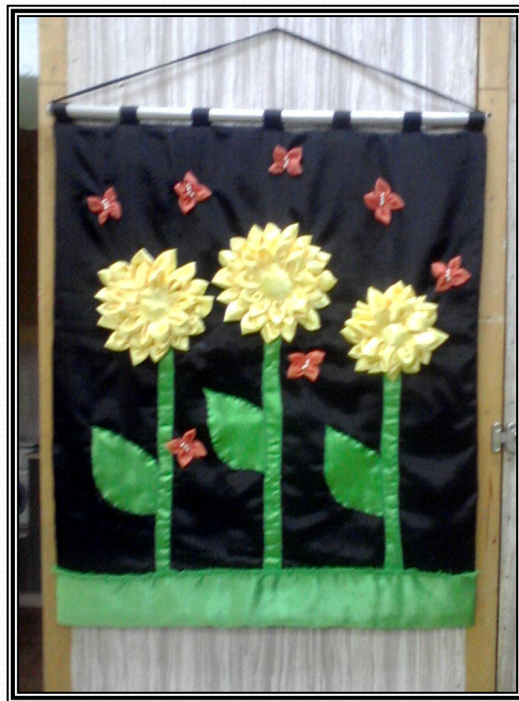
НАСТЕННЫЕ ПАННО В ЛОСКУТНОЙ ТЕХНИКЕ