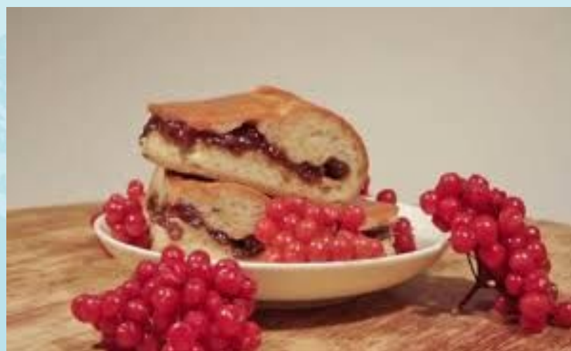
Пирог с калиной