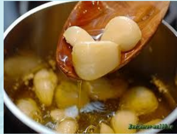
чеснок с медом