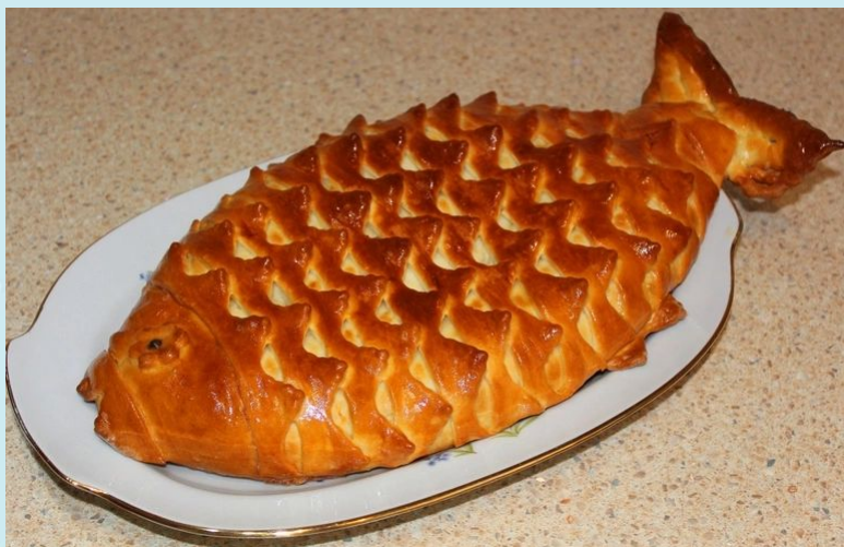
Пирог с рыбой