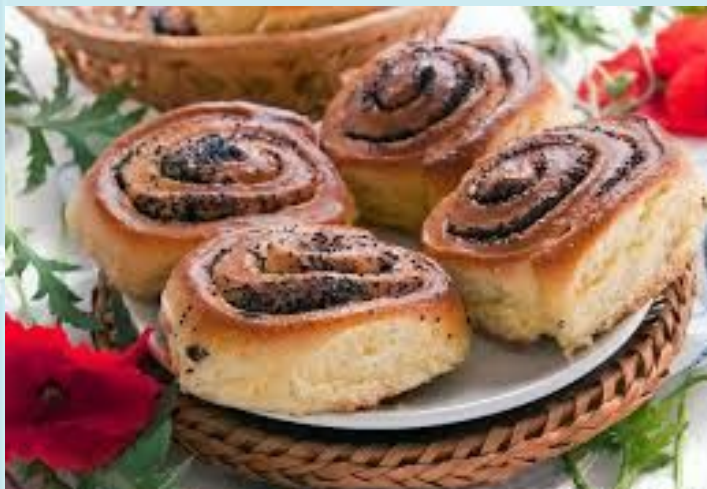
Булочки с ма