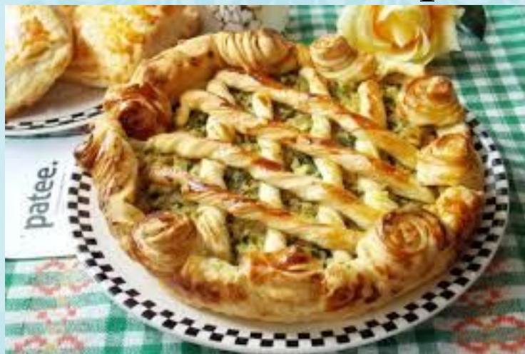
Пирог с капустой