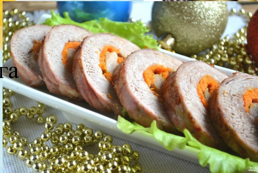
Рулет из свинины.