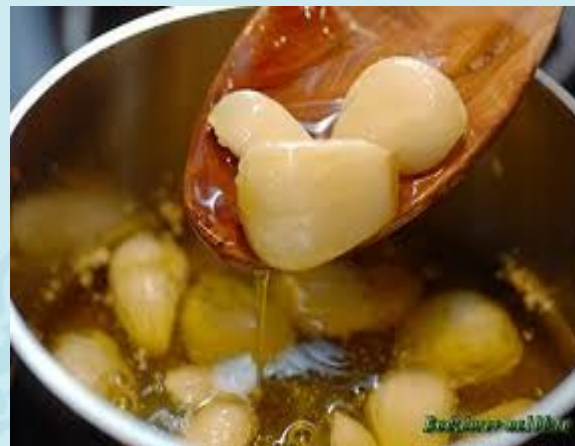
чеснок с медом