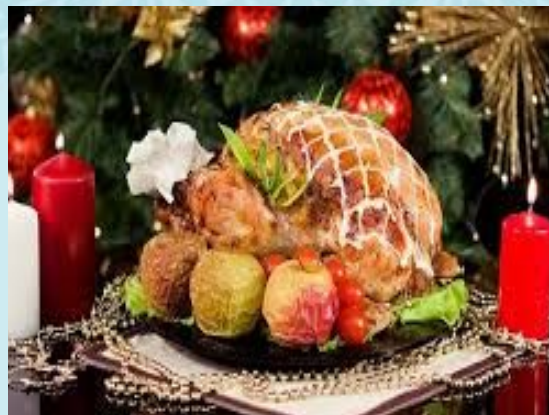
гусь в яблоках