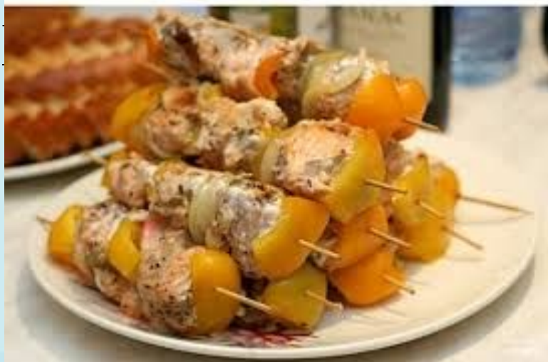
Шашлык из осетрины