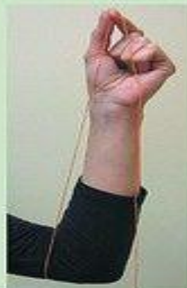
Вдевай в ушко иглы нитку определенной длины