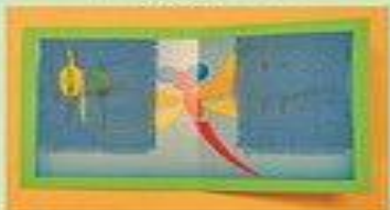
Храни иглы и булавки только в игольнице