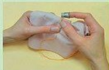
Шей с наперстком