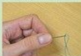
Передавай иглу ушком вперед, а булавку колечком