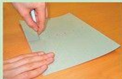
Держи шило правильно. Прокалывай заготовку только на подкладной доске