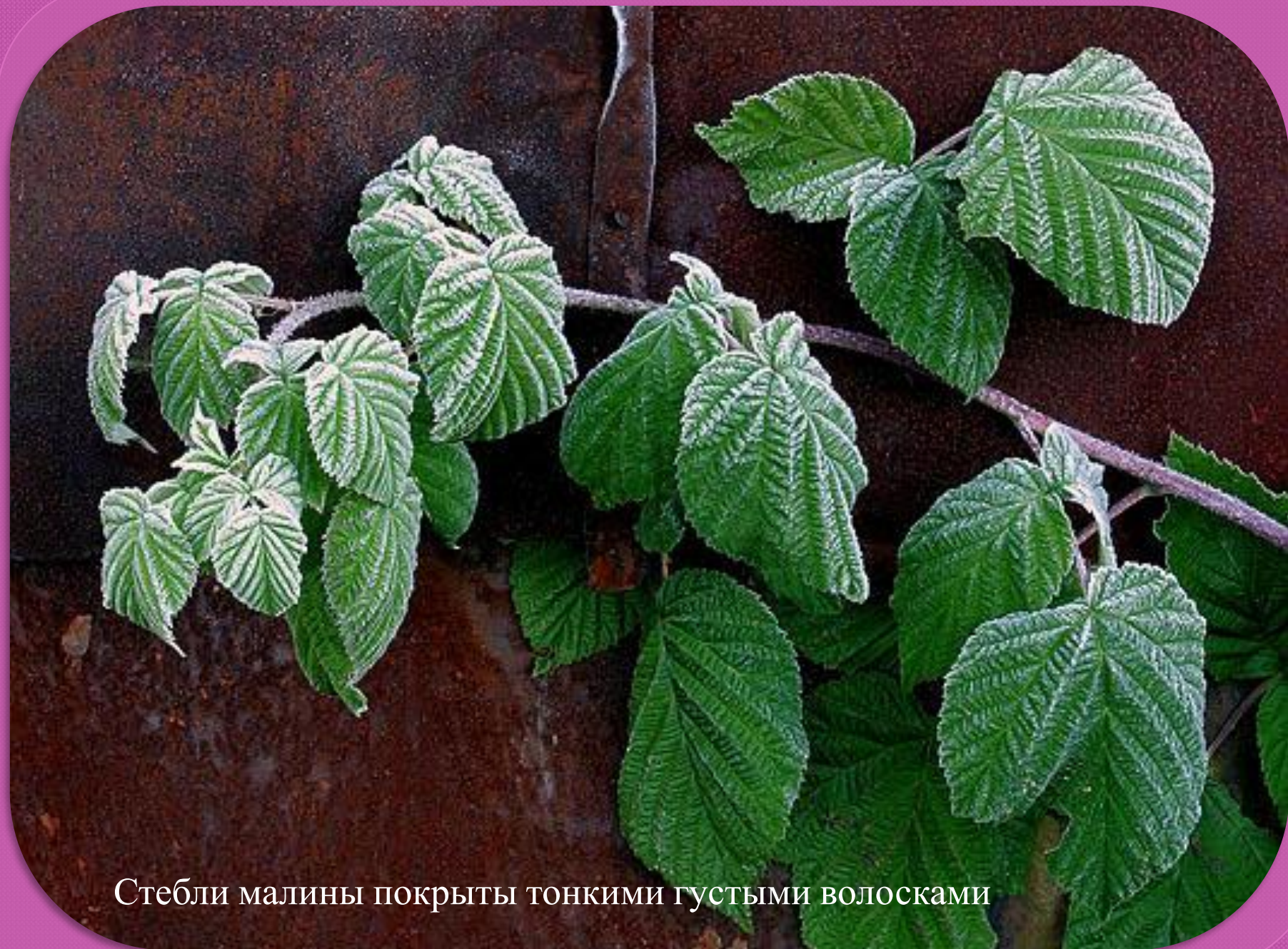
Стебли малины покрыты тонкими густыми волосками