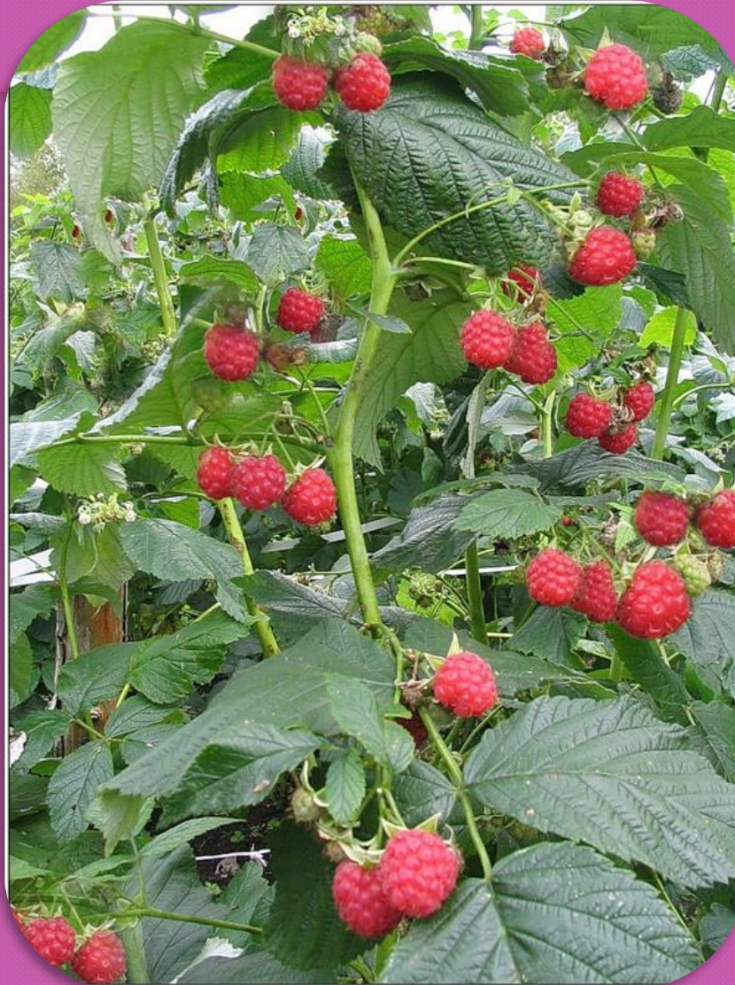
Стебли малины высокие