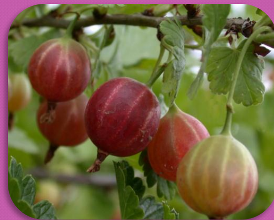
Ягоды зеленой, желтой, розовой, красной и почти черной окраски