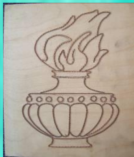
Топтық жұмыс 6 сынып