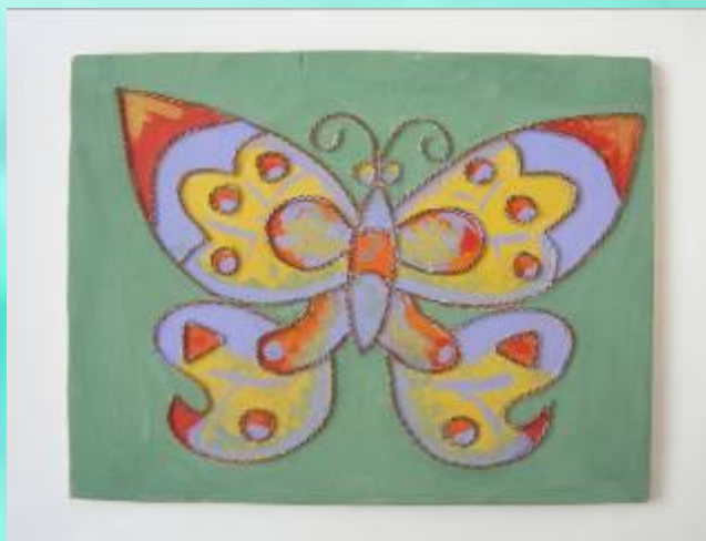
Топтық жұмыс 6 сынып