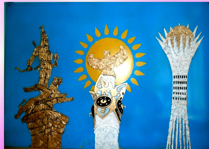
Қарандаш жоңқаларымен жапсырмалау