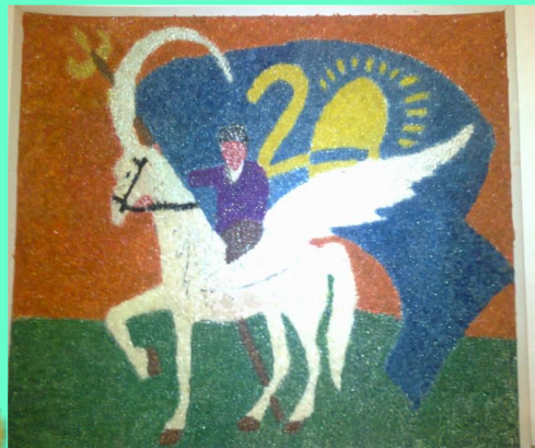
Әр түрлі дәндермен жапсырмалау