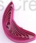
изогнутый полукруг (месяц, полумесяц)