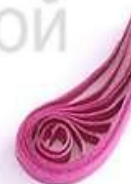
изогнутая капля (крыло, лепесток)