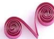
завиток в форме V