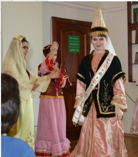
Выступление в институте истории им. Ш. Марджани