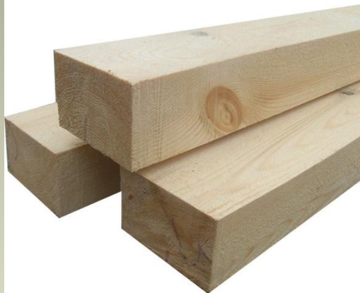
БРУСКИ И БРУСЫ