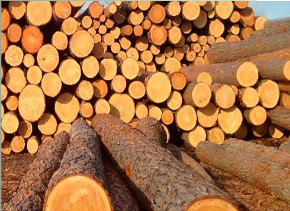
деловую древесину древесину

Хлысты или отрезки, получаемые при поперечном делении — раскряжевке, в зависимости от размеров и наличия пороков разделяют на