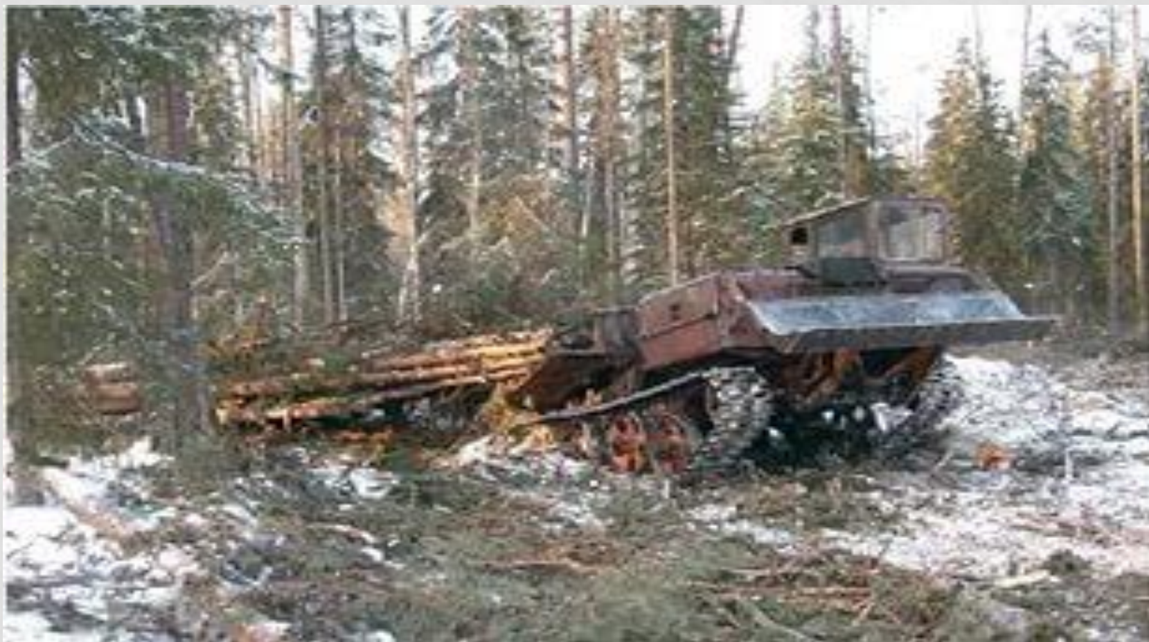
ТРЕЛЁВОЧНЫЙ ТРАКТОР «ТДТ 55 А» ТАЩИТ ПАЧКУ ХЛЫСТОВ