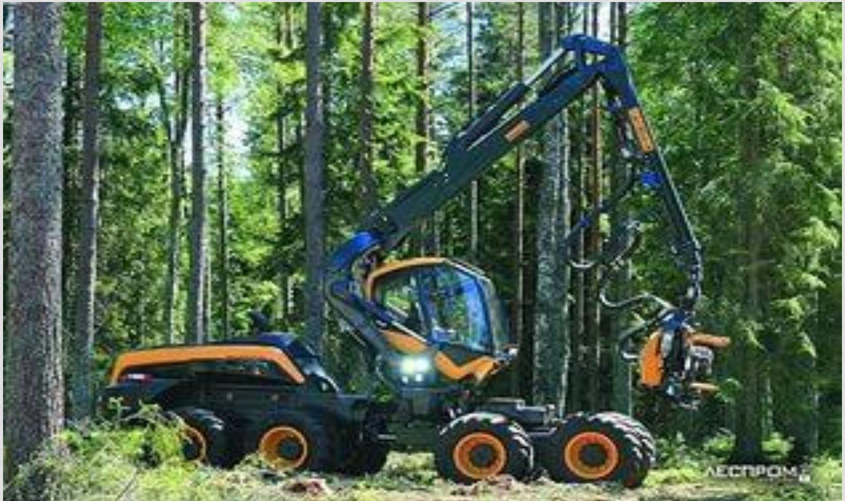
XAPБECTOP ПОНСЕ SCORPION