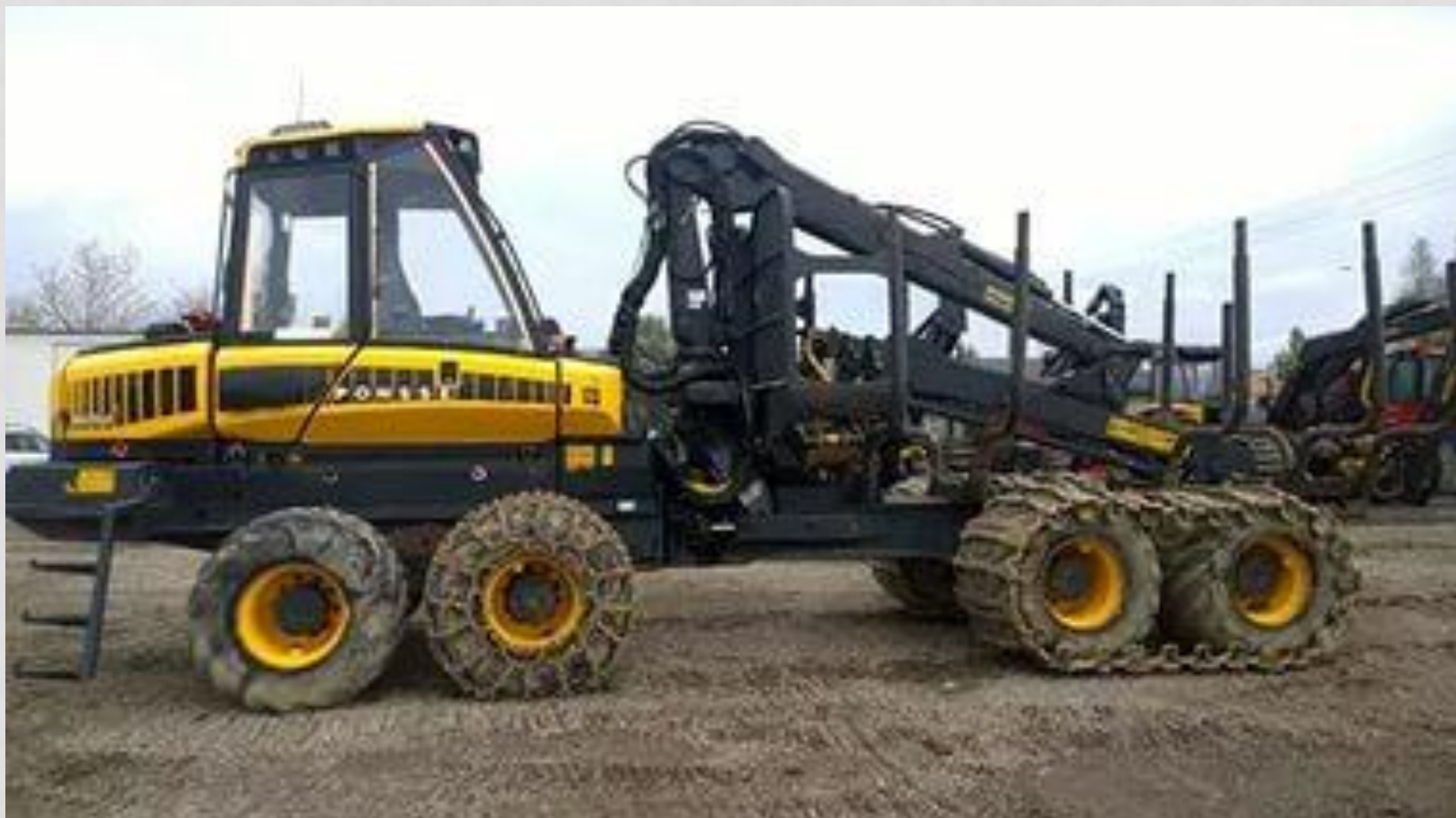
ФОРВАРДЕР PONSE BUFFALO