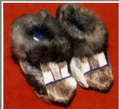
Меховые детский тапочки