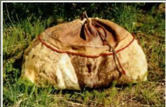
Вусс (большая сумка)