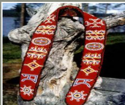
Праздничный женский пояс