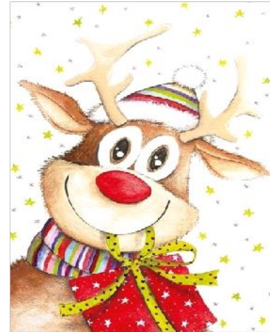
Вариант № 3