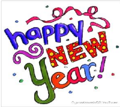
Вариант № 2