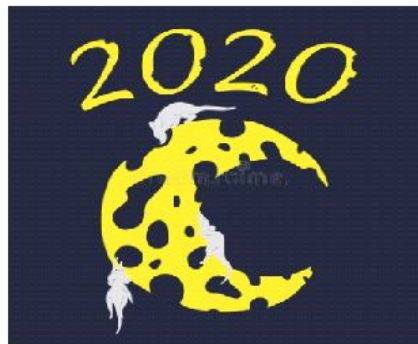
Вариант № 5