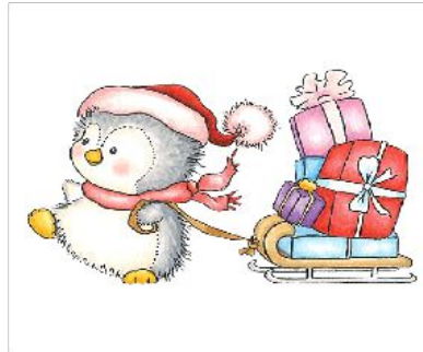
Вариант № 3