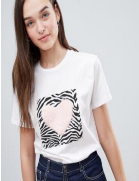
Роспись по трафарету