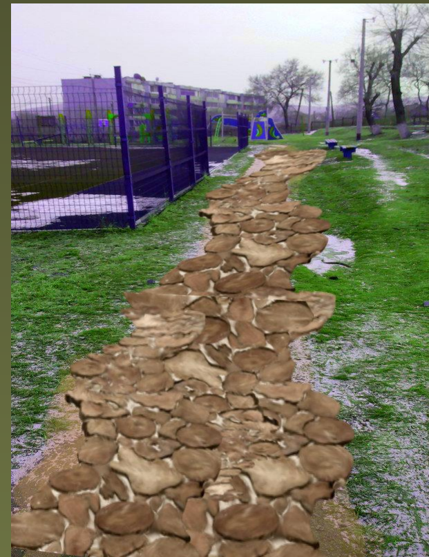
Дорожки из каменной кладки, огороженной бордюром.