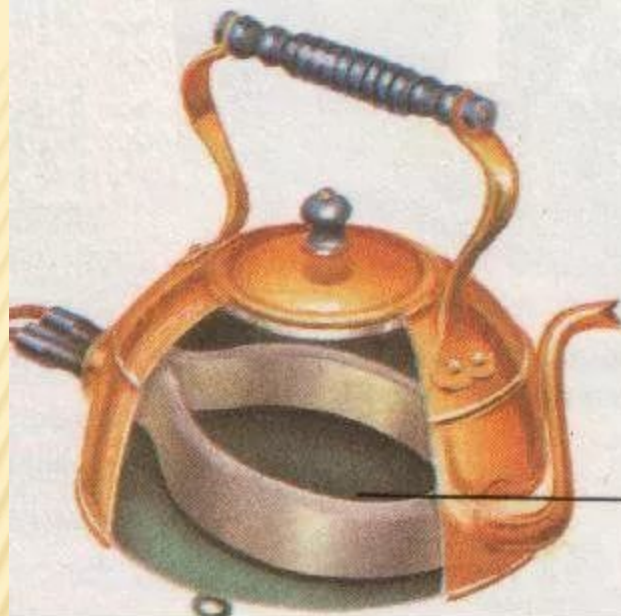
Электрический чайник выпуска 1920 г.