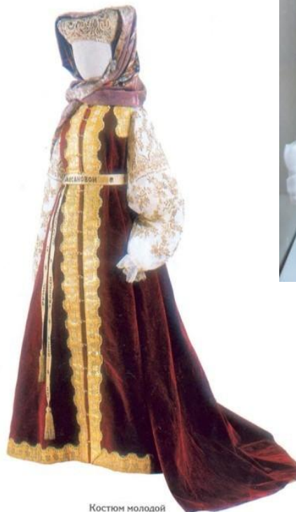
Костюм молодой замужней уральской казачки Конец XVIII — XIX век

История Дона напрямую связана с историей народов, его населявших и населяющих. В разных частях света, в разных странах развитие общества имело свои специфические особенности, и все они, климатические, социальные, национальные и эстетические, - ярко выражены в многообразии казачьих костюмов.