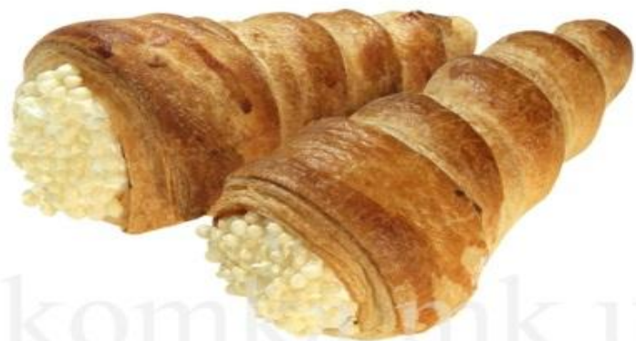
Пирожное слоёное "Трубочки" (с белковым кремом)