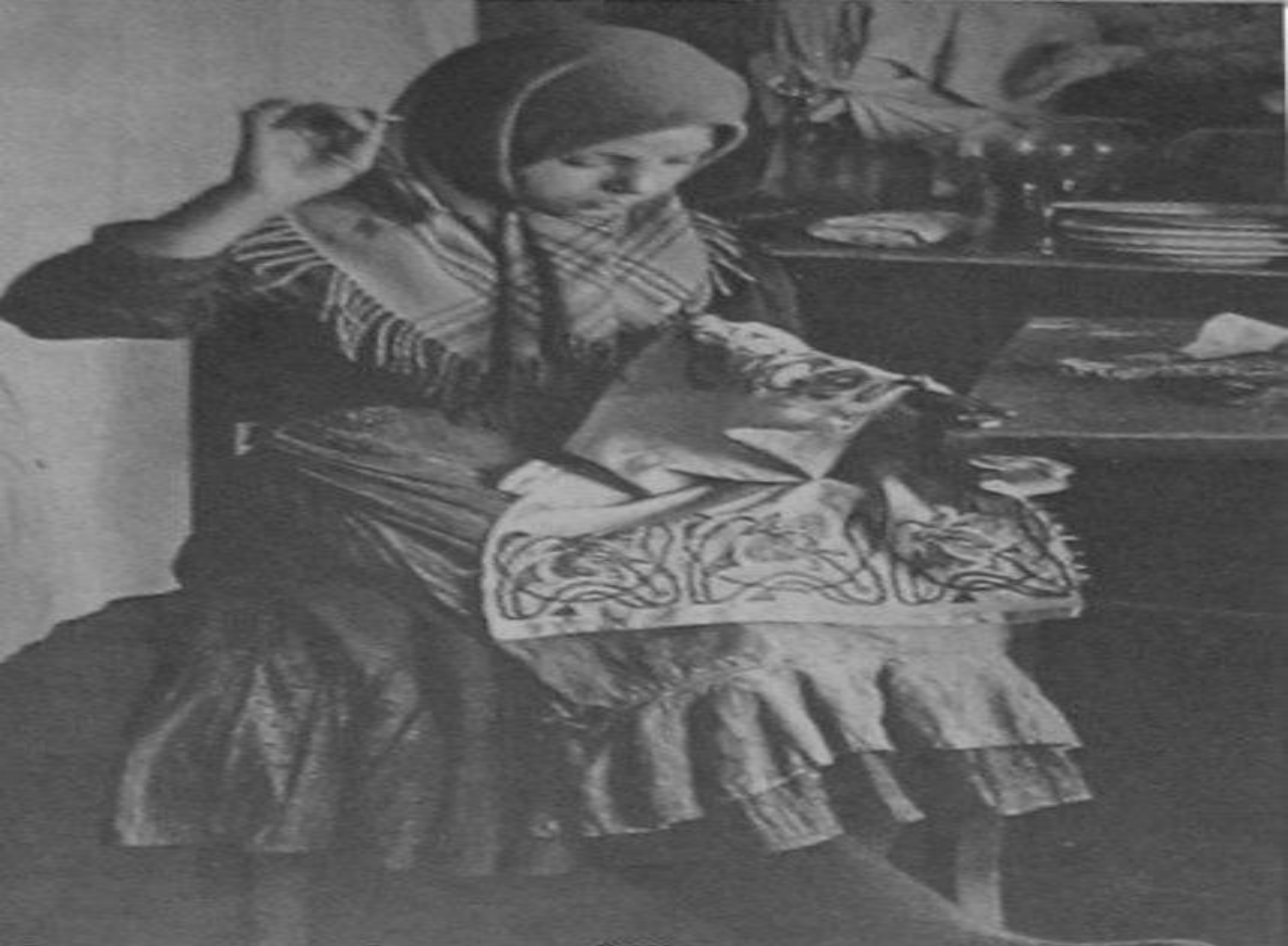
Девочка за вышиванием. Владимирская губ. 1914г.