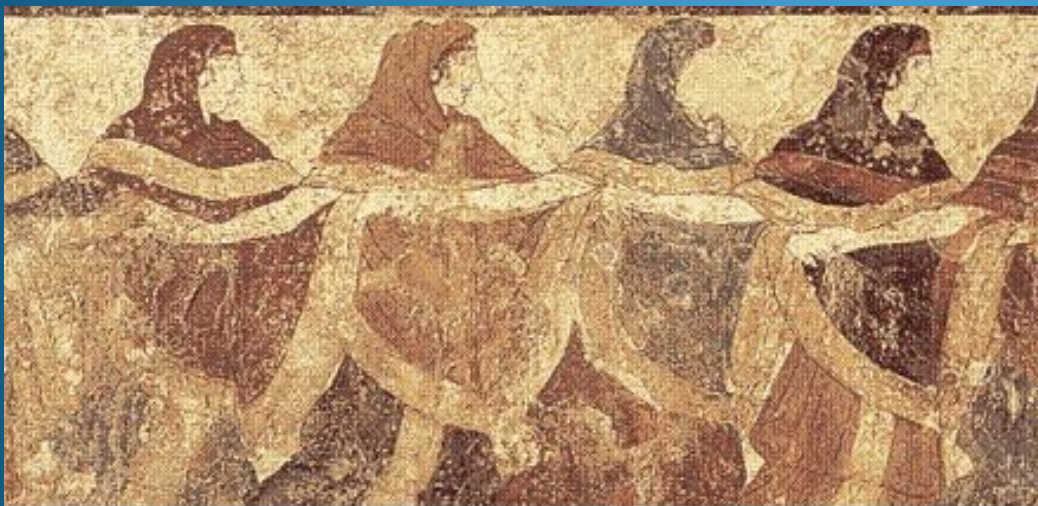
Хоровод Этрусская фреска

Танец и песня — это проявления народного творчества. У каждого народа есть свои национальные танцы, по которым понятна принадлежность к какому-либо государству. У простых людей после тяжёлой работы на поле было только одно развлечение — водить хороводы. В поместьях богатых людей танцевали специально нанятые танцоры, чтобы скрасить скучный вечер вельможи.