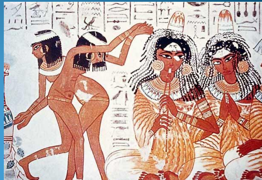
Западный танец- Египет

Развернутые танцевальные представления, нередко связанные с религиозными церемониями, существовали в Древнем Египте, Индии, Китае, Греции, Риме и других странах.