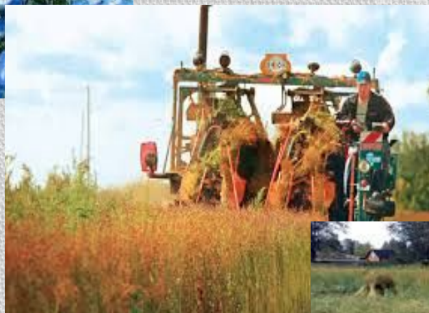
снопы из льняной соломы