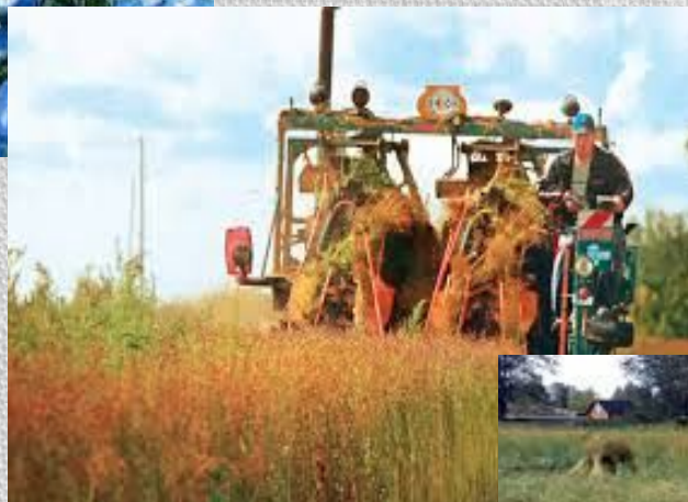
снопы из льняной соломы