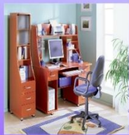
Правильно подобранная мебель