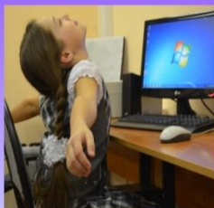
Минутка отдыха при работе за компьютером