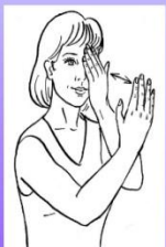
Зарядка для глаз