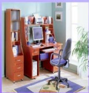
Правильно подобранная мебель