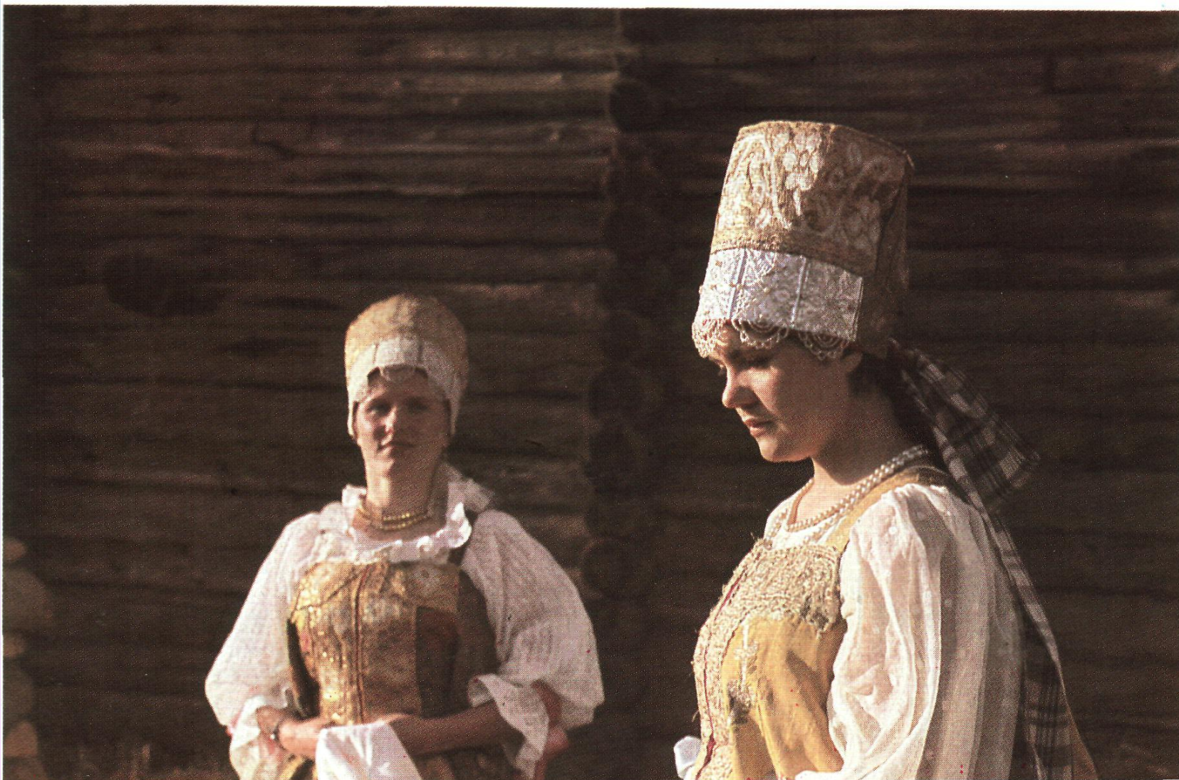
Девичья парчовая повязка с жемчужной обнизью