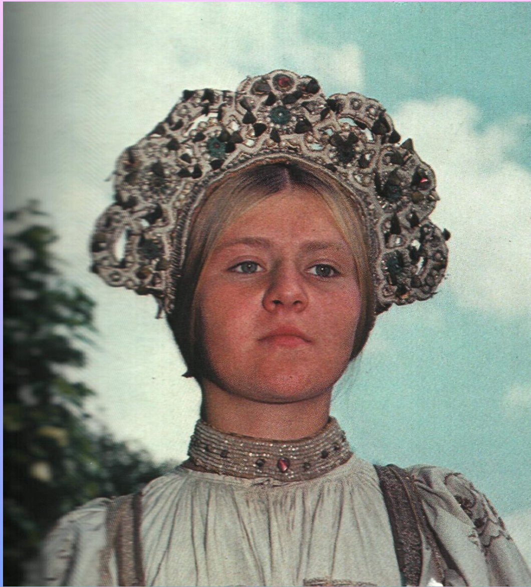
Каргопольский свадебный венец-коруна, вышитый жемчугом. Первая половина 19 века