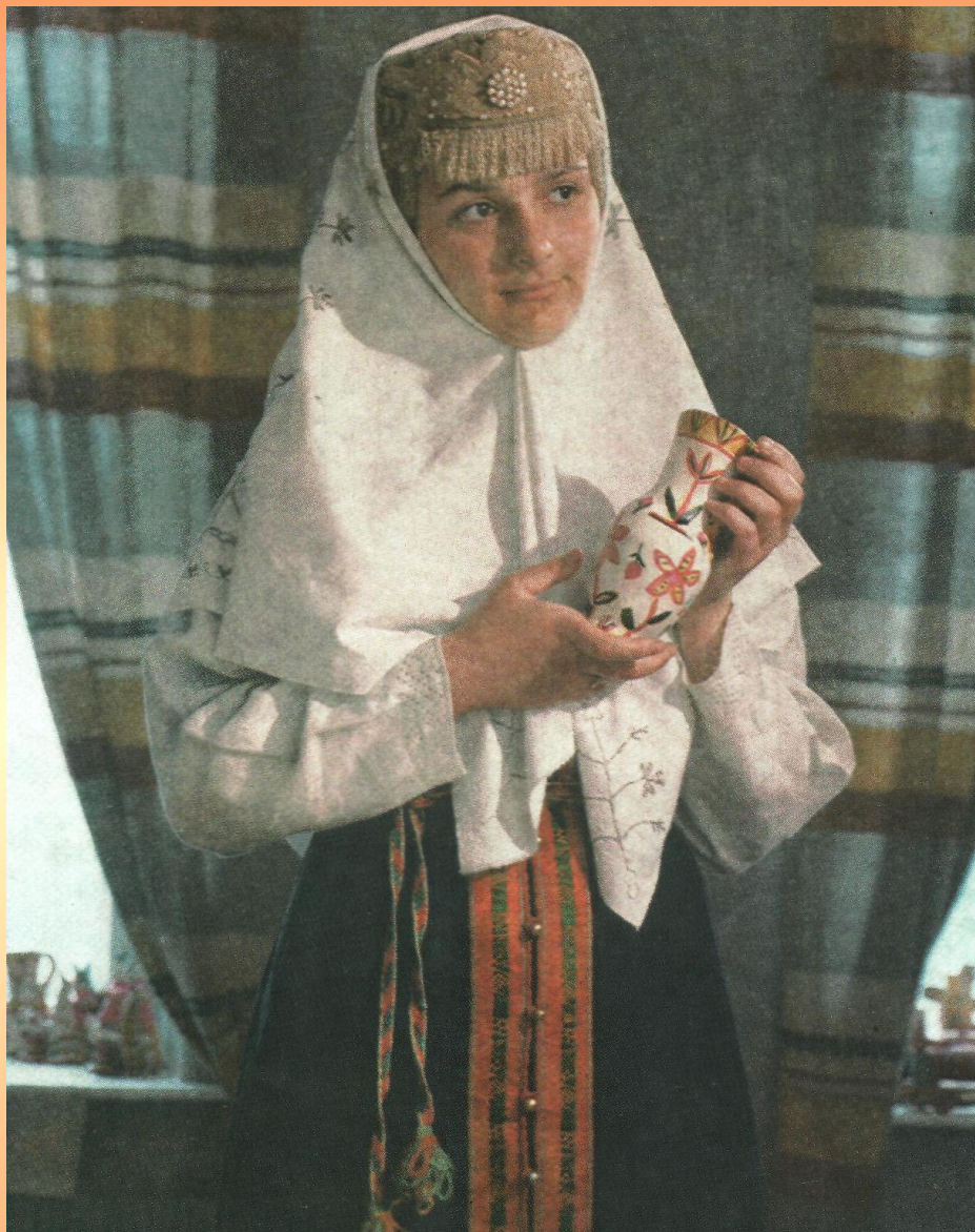
Каргопольский вариант олонецкой кики с рогом. Вторая половина 19 века