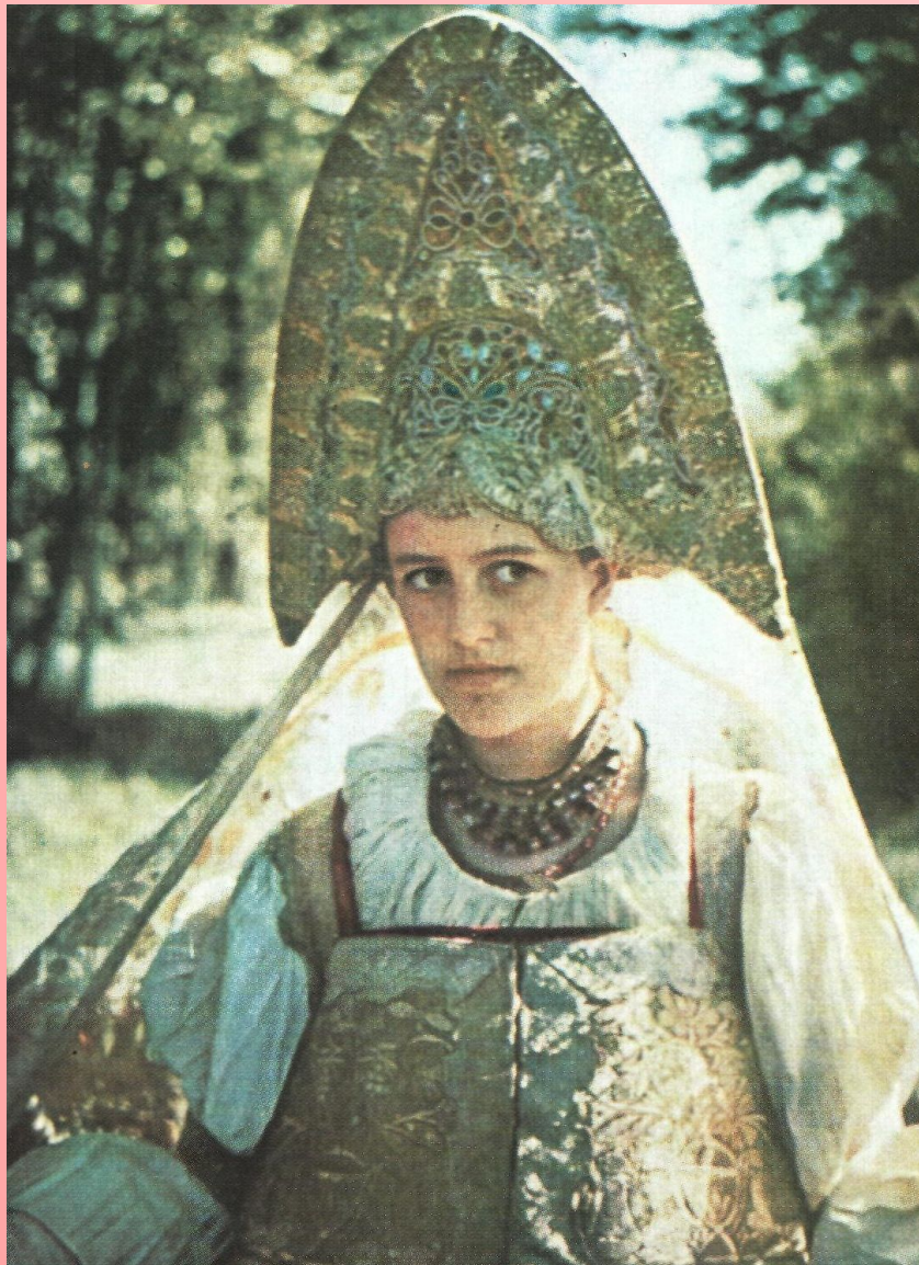
Нижегородский кокошник из парчи, шитый золотом и жемчугом. Первая половина 19 века