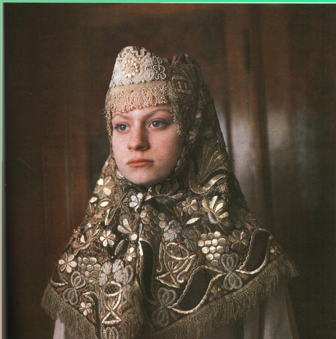
Женский головной убор кичка и шитый золотом платок