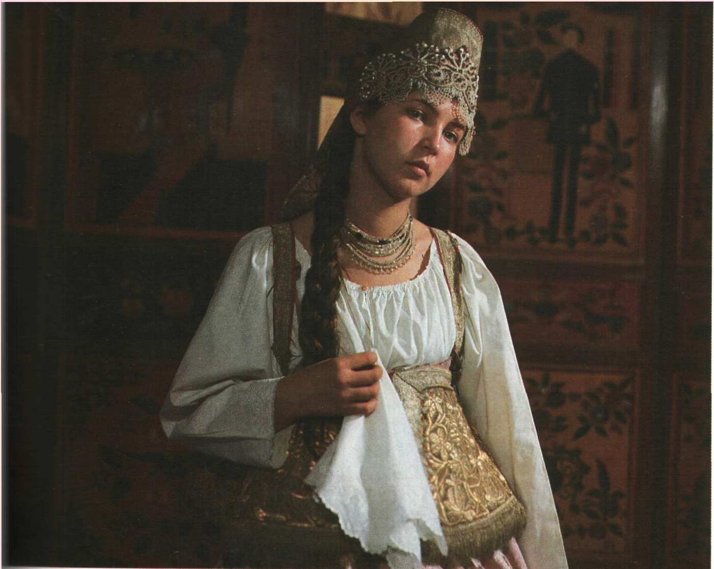
Головная повязка северная. Первая половина 18 века