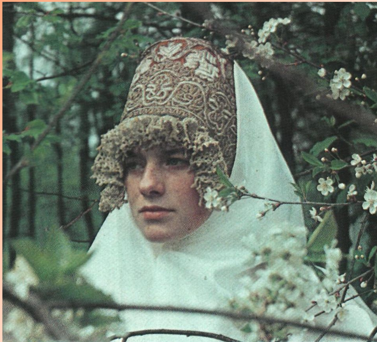
Новгородская кика с жемчужной густой обнизью. Конец 18 века