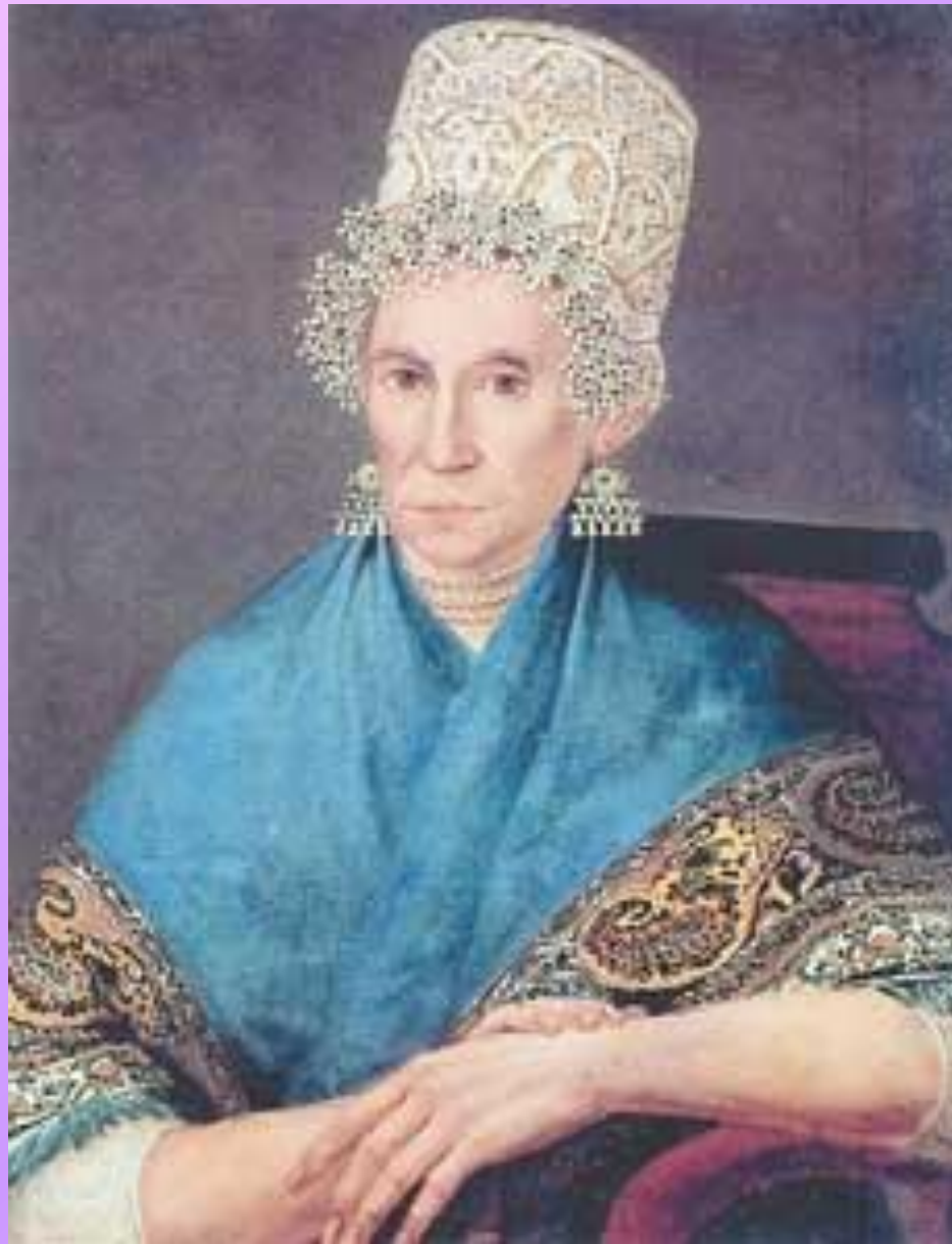
Неизвестный художник. Портрет пожилой купчихи.