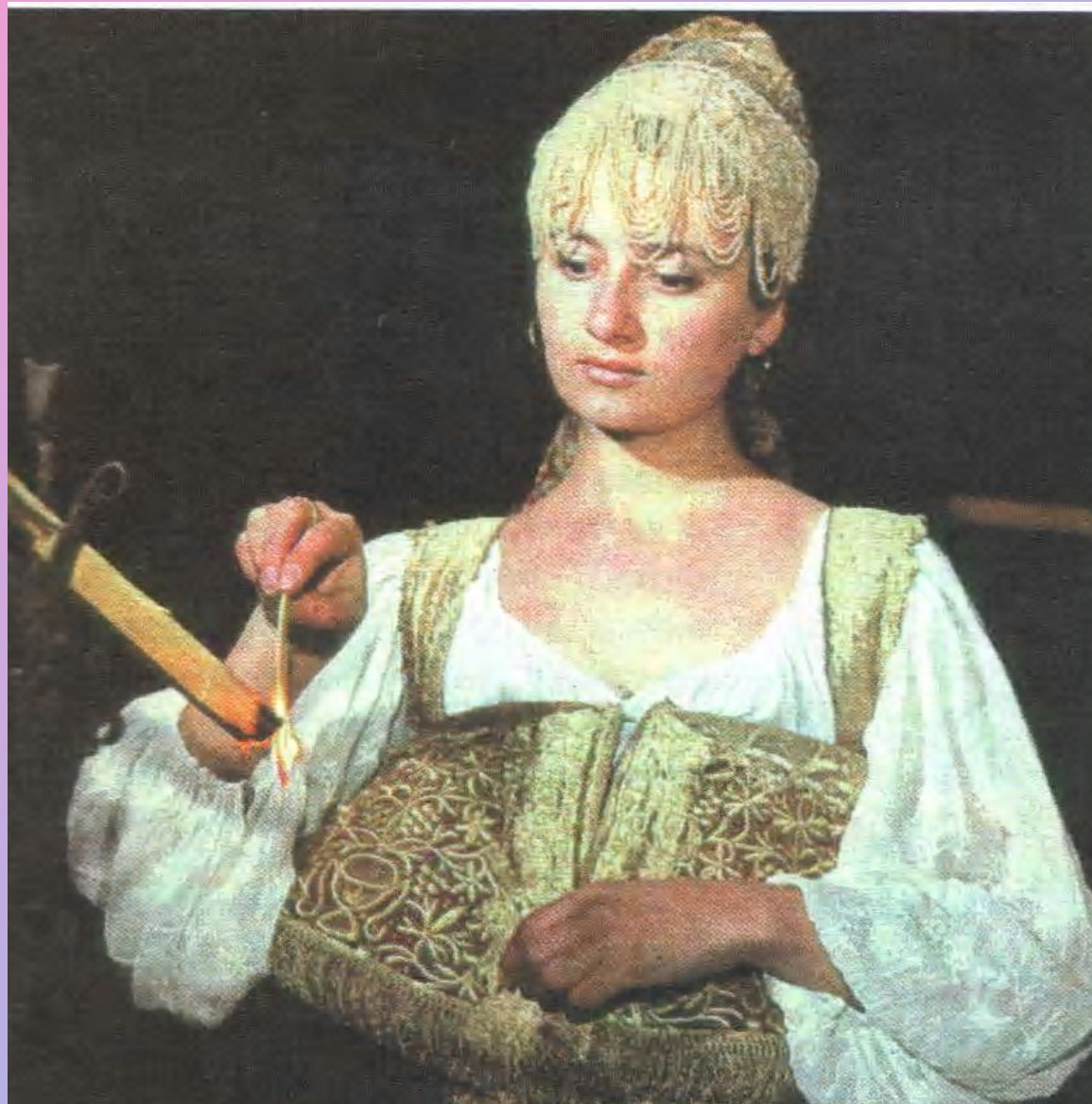
Праздничный головной убор девушки