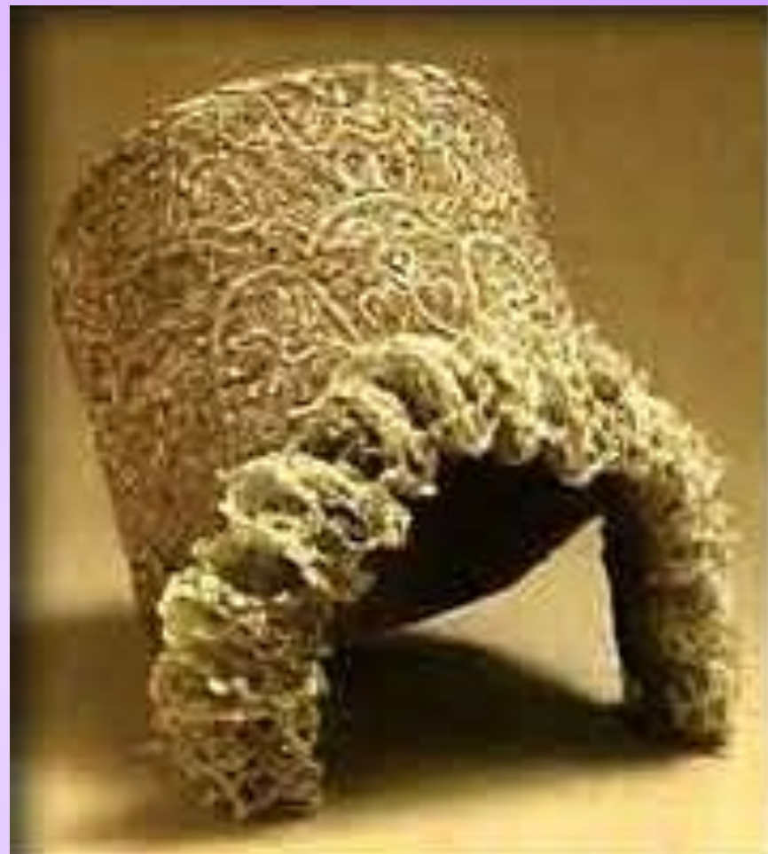
Новгородская кика шитая золотом с густой жемчужной обнизью.