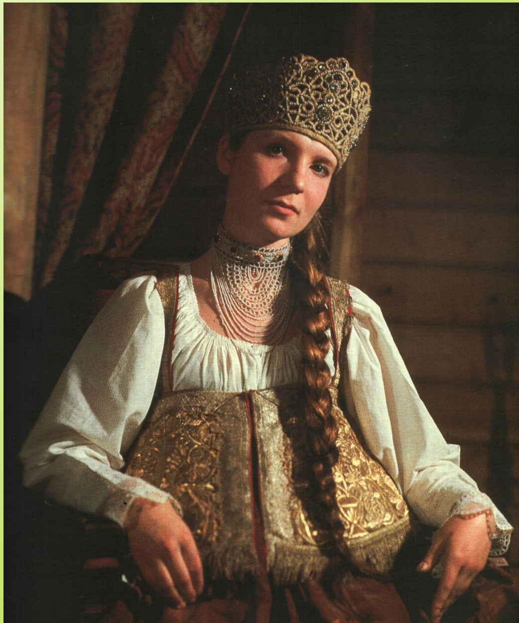
Девичья коруна – свадебный убор невесты северного края. 19 век