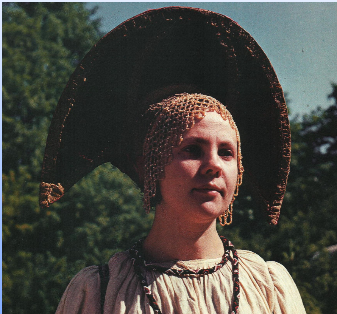
Симбирский кокошник с золотым позументом и бисерной поднизью. Первая половина 19 века