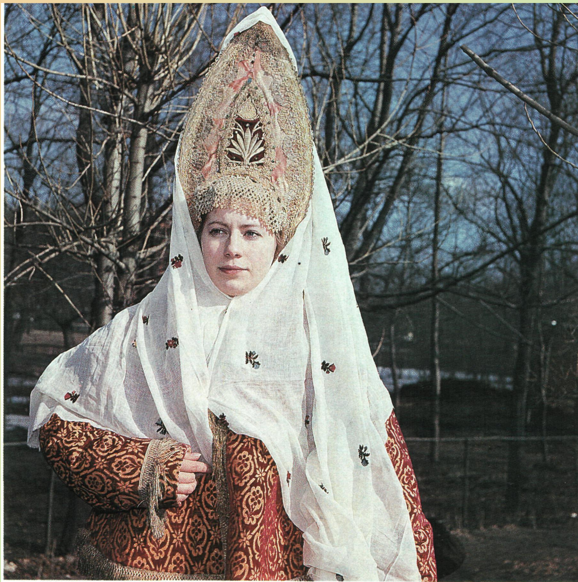
Женский головной убор Костромской губернии