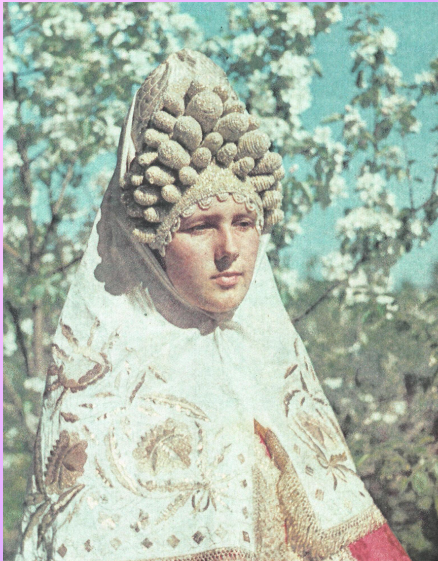
Псковский кокошник и шитый золотом белый плат