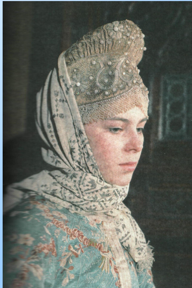
Костромской «сборник», вышитый жемчугом с жемчужной поднизью. Первая половина 19 века