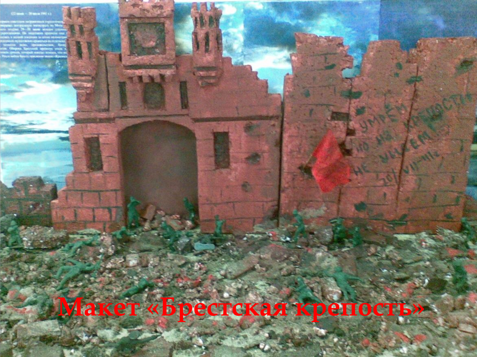
Макет «Брестская крепость»