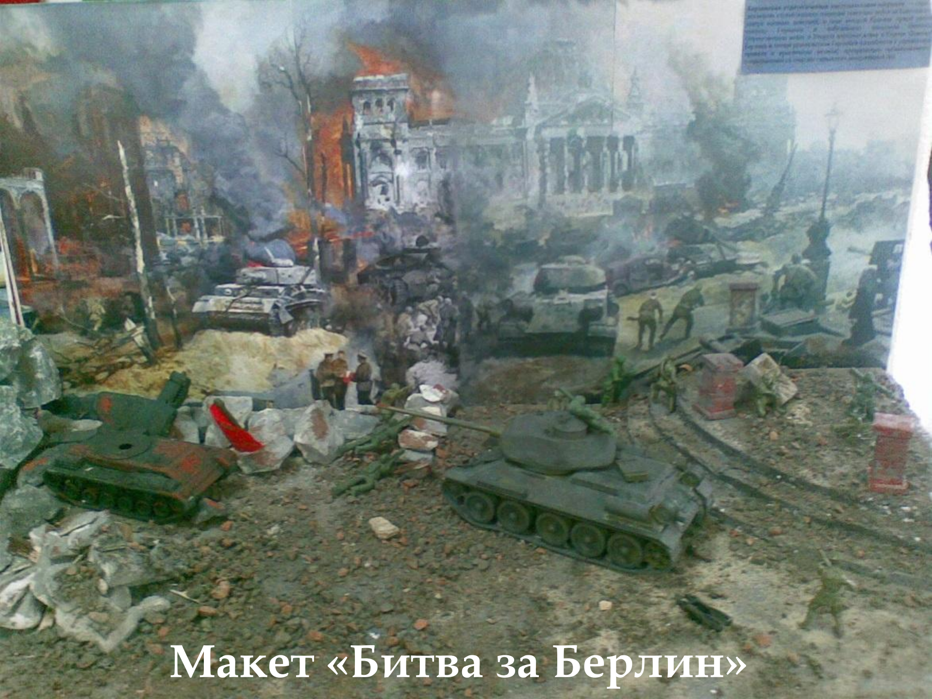
Макет «Битва за Берлин»