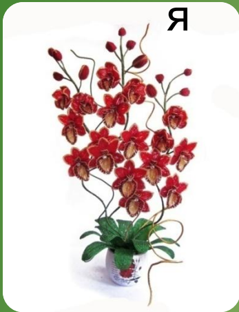
Я Цветочные композиции