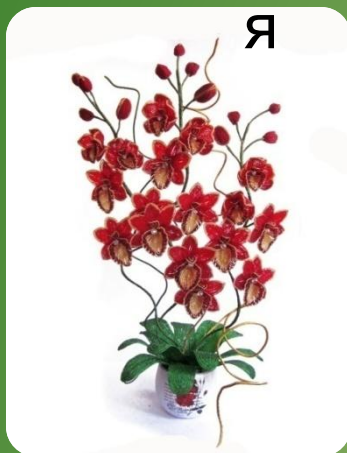
Я Цветочные композиции