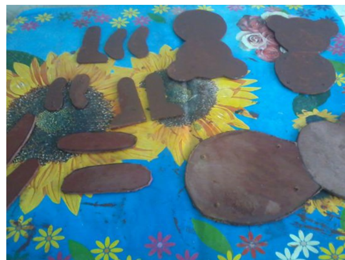
Обучающиеся 5 класса изготавливают движущиеся игрушки.