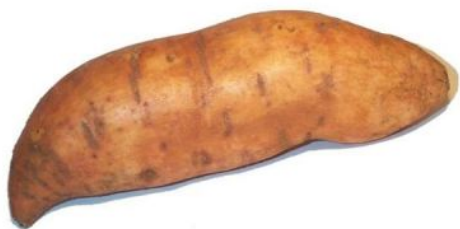
батат (сладкий картофель)