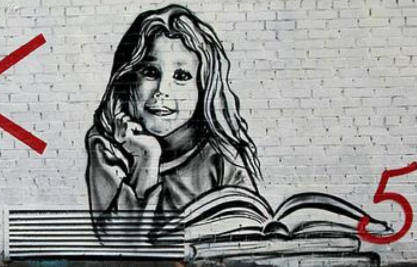
Паша18з. Москва, Россия