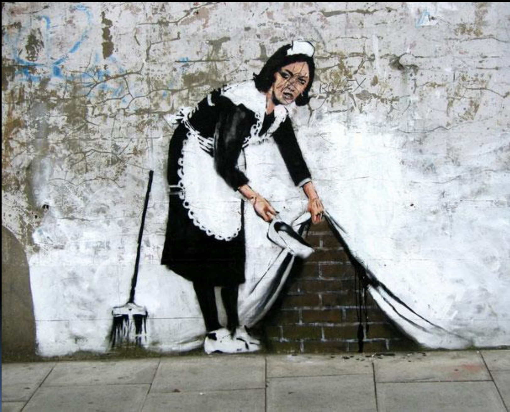
Бенкси «горничная в Лондоне», Великобритания