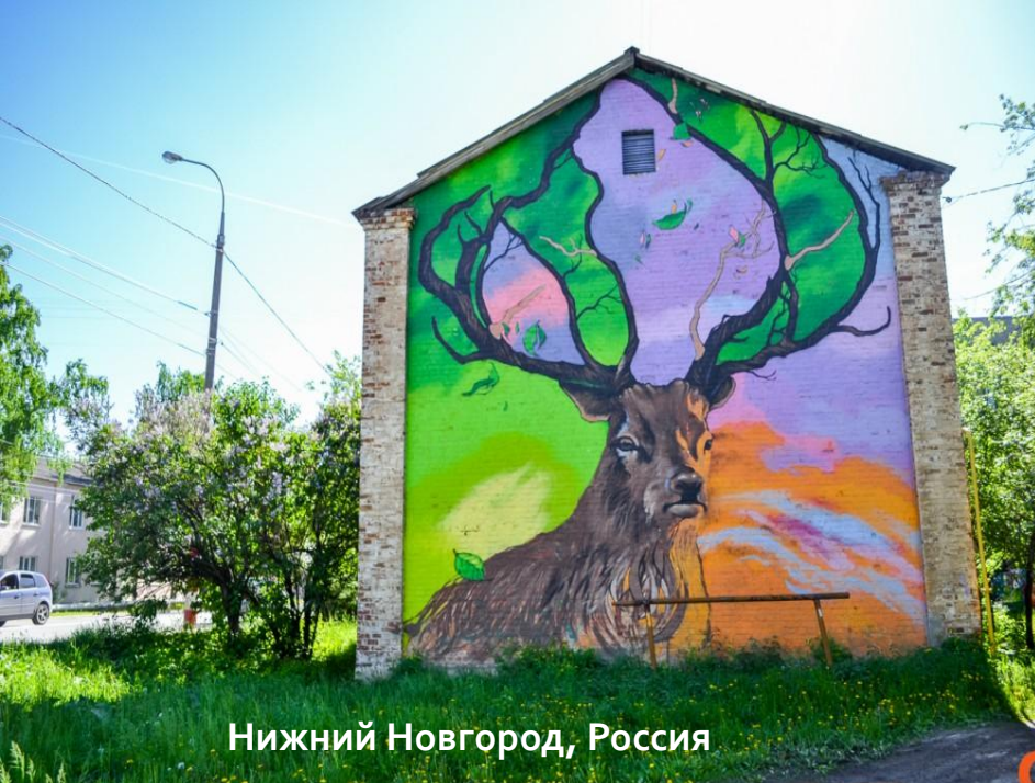
Нижний Новгород, Россия