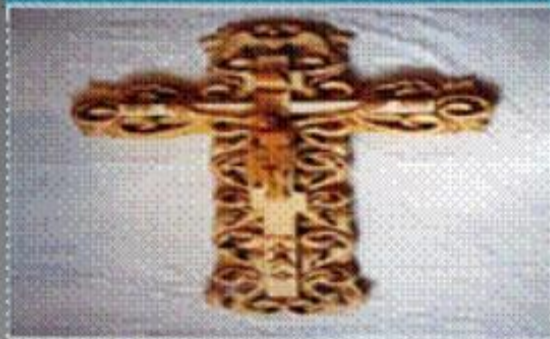
Прорезная, или ажурная