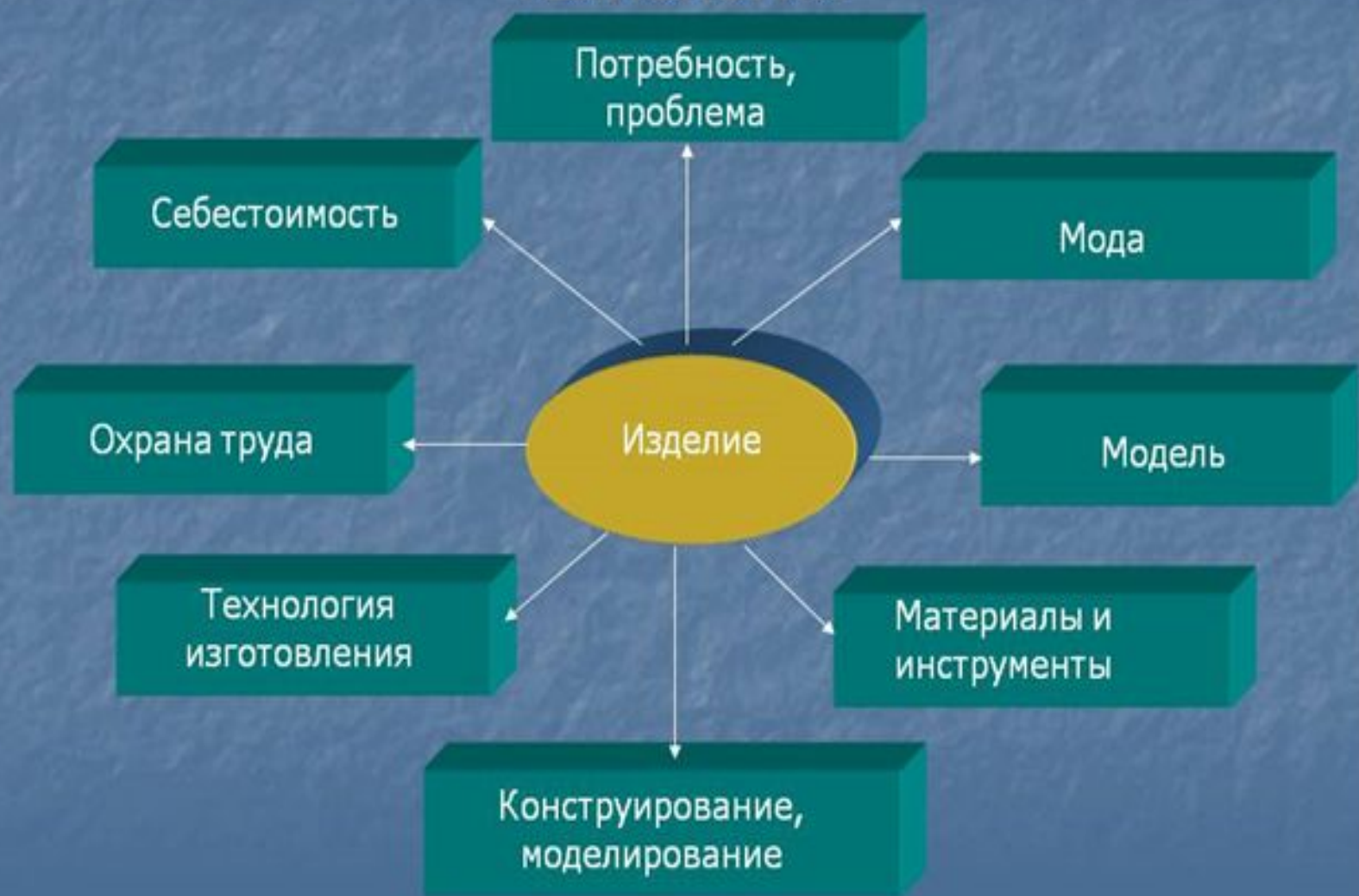
Схема выполнения проекта по ТЕХНОЛОГИИ