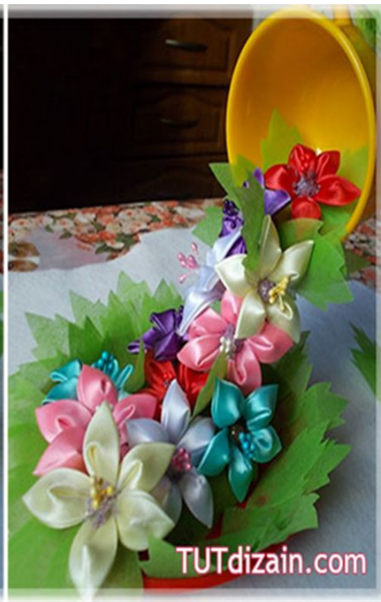
Топиарий в технике канзаши