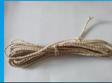
Джутовый шнур плетеный