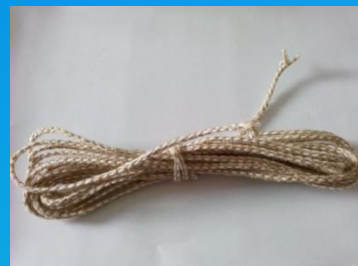
Джутовый шнур плетеный