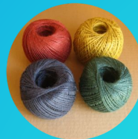
Джутовый шпагат цветной