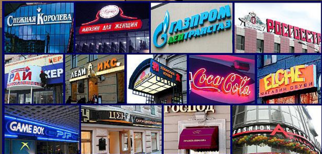
Вывески неоновые, короба световые, крышные установки, объемные буквы, маркизы, консоли.